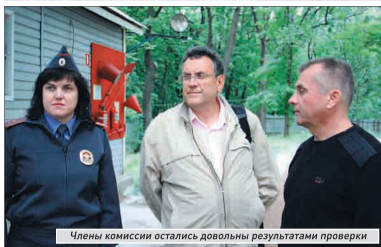
Члены комиссии остались довольны результатами проверки