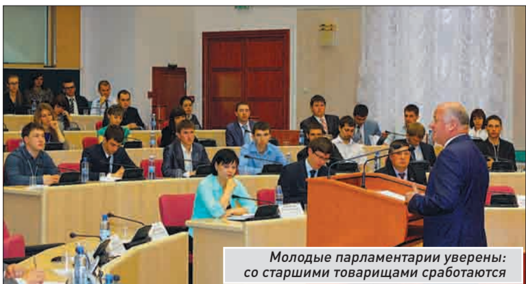
Молодые парламентарии уверены: со старшими товарищами сработаются