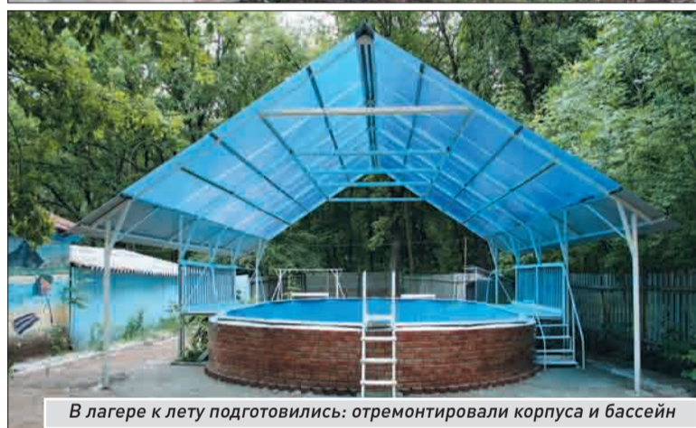
В лагере к лету подготовились: отремонтировали корпуса и бассейн

Устинов, завершается подготовка к лету огороженной спортивной площадки-трансформера. Здесь ребята смогут играть и в баскетбол, и в волейбол. Готова она будет как раз к открытию «Юности» — к 1 июня.