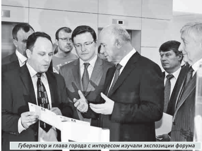
Губернатор и глава города с интересом изучали экспозиции форума

После осмотра экспозиции Николай Меркушкин поздравил предпринимателей с праздником. Особо он отметил: за последние пять лет на 61% выросло поступление налогов в областной бюджет от малого и среднего бизнеса,