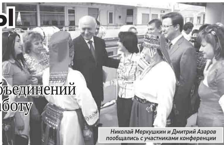
Николай Меркушкин и Дмитрий Азаров общаются с участниками конференции

На торжественном открытии участников конференции приветствовали губернатор области