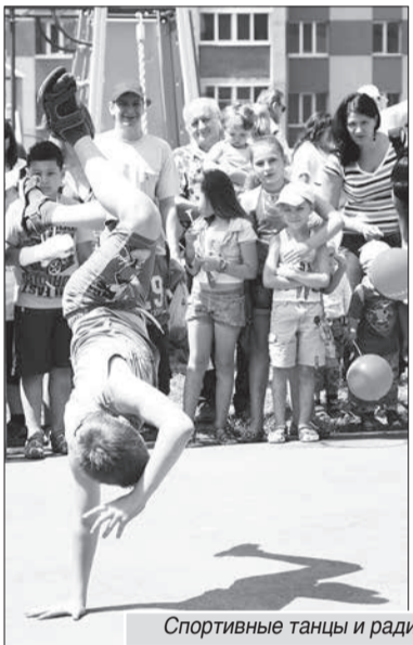
Спортивные танцы и радиоуправляемая машина — хит праздника!

цель подарить нашим детям настоящий праздник, чтобы они не чувствовали здесь себя чужими и общались все вместе. Возможно, эту идею подхватят другие», — отметила она.