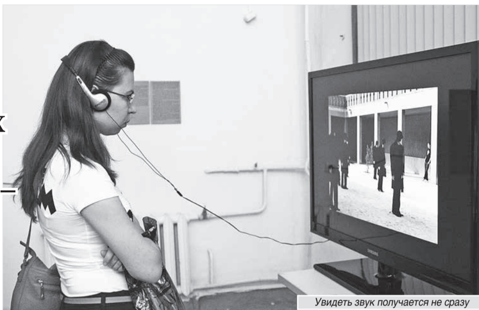
Увидеть звук получается не сразу