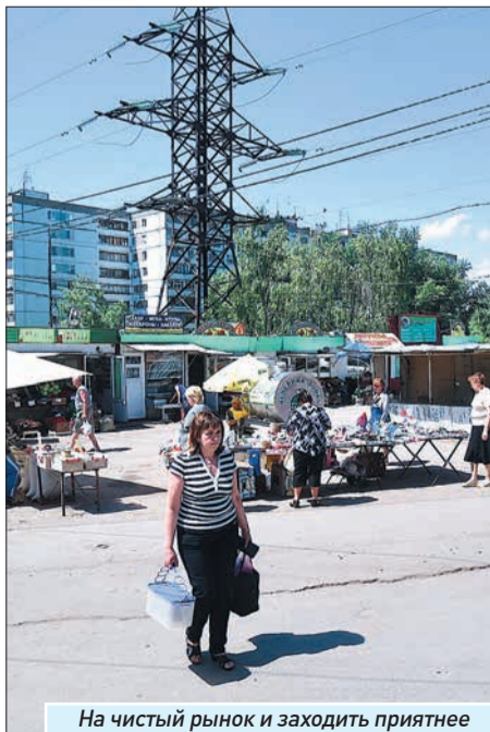
На чистый рынок и заходить приятнее