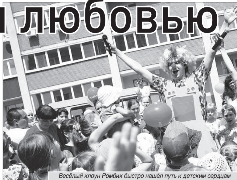
Весёлый клоун Ромбик быстро нашёл путь к детским сердцам

Все мысли о своём здоровье у юных гостей праздника пропали с той минуты, когда в центр зала под задорную музыку выехали ребята-танцоры на колясках. Кроме хореографических номеров были песни и стихи. В выступлениях активно участвовали и родители, привыкшие всегда быть рядом. В зале тоже собрались ребята с ограниченными возможностями. Они активно поддерживали выступающих,