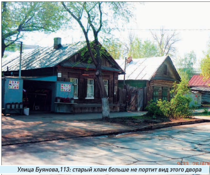
Улица Буянова, 113: старый хлам больше не портит вид этого двора