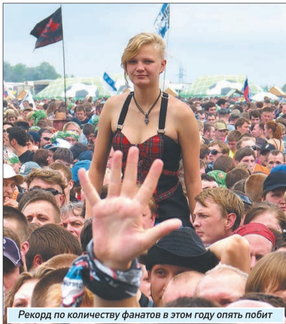
Рекорд по количеству фанатов в этом году опять побит

имеющая не самое прямое отношение: большинство её песен стоит отнести к французскому шансону. Вновь зрители притихли, вновь на фестивальную площадку вернулось лирическое настроение. Выступление первого из зарубежных гостей пришлось по вкусу любителям французского и вообще всем эстетам.