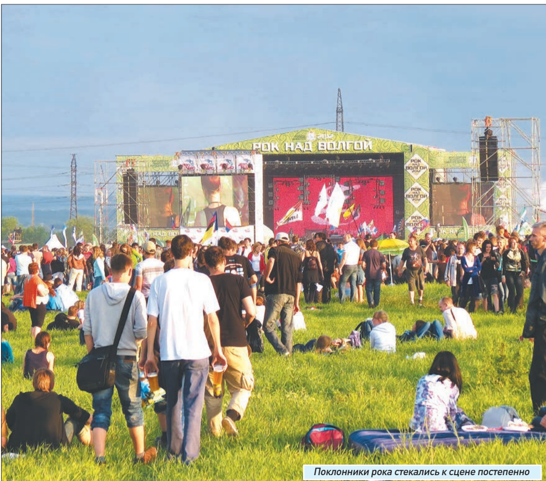
Поклонники рока стекались к сцене постепенно