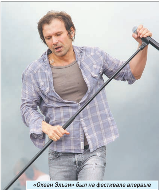
«Океан Эльзи» был на фестивале впервые