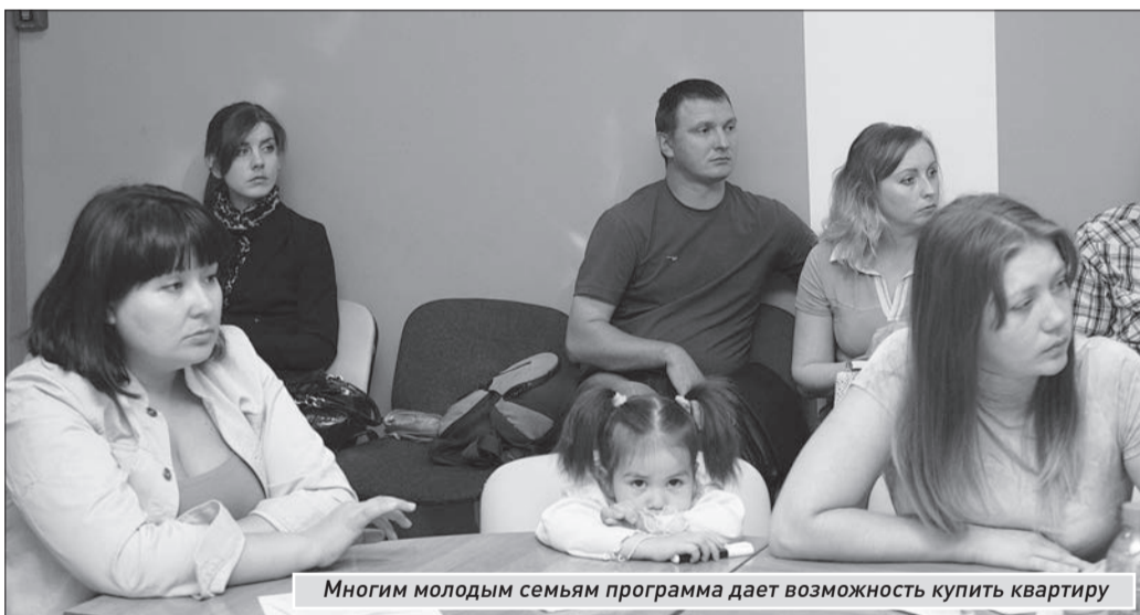
Многим молодым семьям программа дает возможность купить квартиру

По вопросам участия в программе можно обратиться к сотрудникам управления по жилищным вопросам городского департамента управления имуществом: ул. Красноармейская, 17, каб. 304, тел. 332-11-30. Приемные дни: понедельник, среда, с 9.00 до 12.00 и с 14.00 до 17.00.