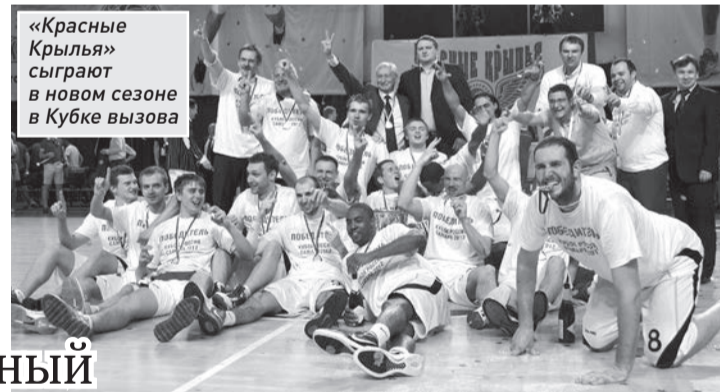
«Красные Крылья» сыграют в новом сезоне в Кубке вызова

Никаких заявлений об уходе я не получал.