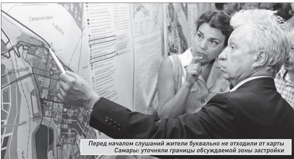
Перед началом слушаний жители буквально не отходили от карты Самары: уточняли границы обсуждаемой зоны застройки

- Те, кто не хотят переноса порта, просто не знают, что это за место, в каком оно состоянии. Там нет памятников архитектуры или исторических зданий. Это пустырь и груды металлолома. Я не понимаю, в чем его ценность. Второй момент, на который я пытаюсь обратить внимание каждого спорящего, это состояние жилых массивов на берегах Волги и Самары. Если вдоль Волги недвижимость в цене, там красивая набережная, куда все приходят погулять, то как выглядит поселок Запанской, себе мало кто представляет. А я там был, и это неприятное место с покосившимися домами... Стать принимающей стороной игр чемпионата мира-2018 - единственный шанс, чтобы в Самаре что-то начали делать масштабно, решать проблемы, которые копились годами. И упустить его мы просто не имеем права.