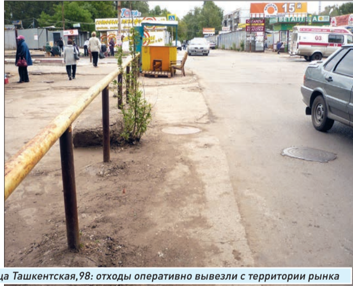
Улица Ташкентская, 98: отходы оперативно вывезли с территории рынка