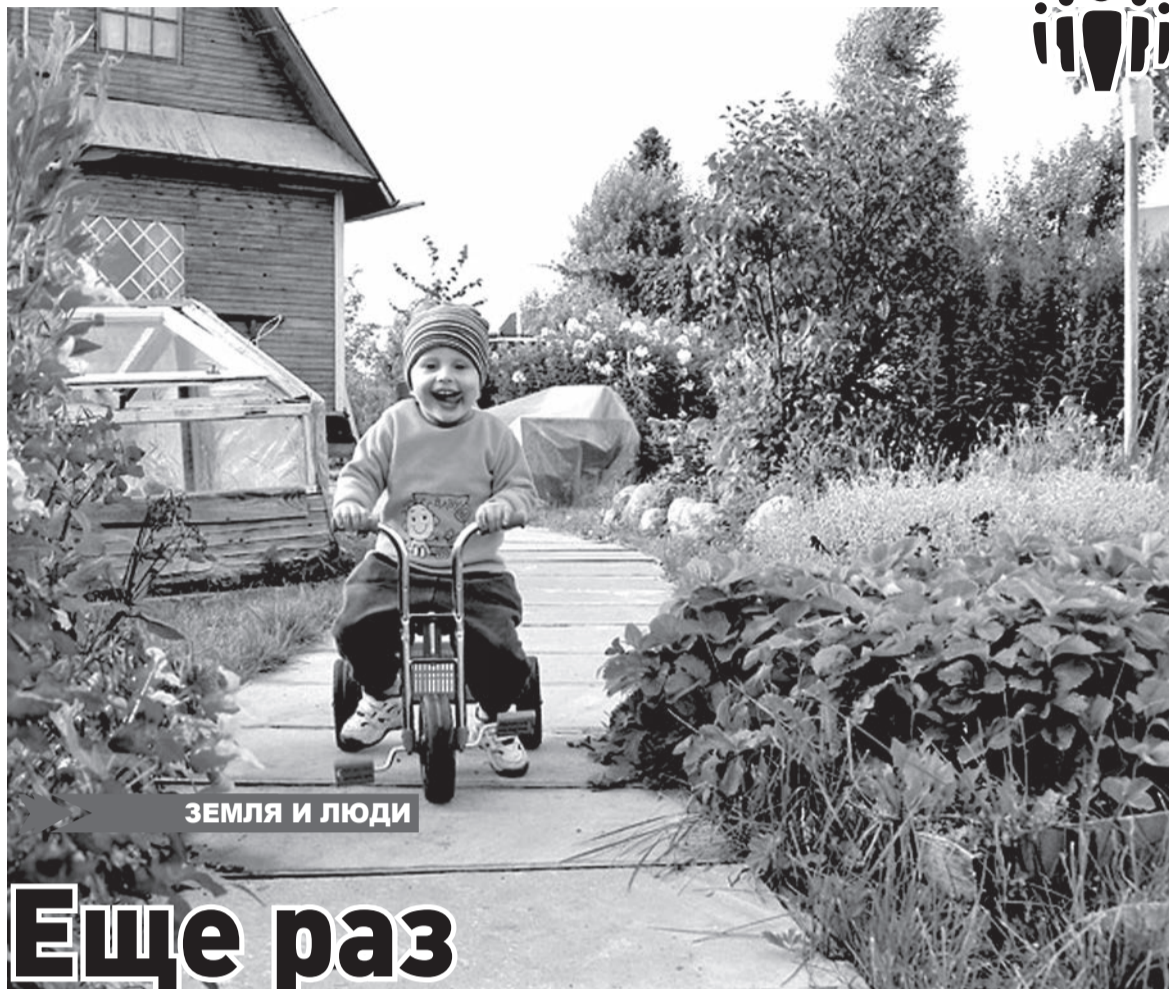
ЗЕМЛЯ И ЛЮДИ

Вам следует посчитать, сколько дней ноутбук находился в сервисном центре. Возможно, гарантийный срок еще не истек. Тогда проблем у вас не будет, и вам должны будут отремонтировать ноутбук.