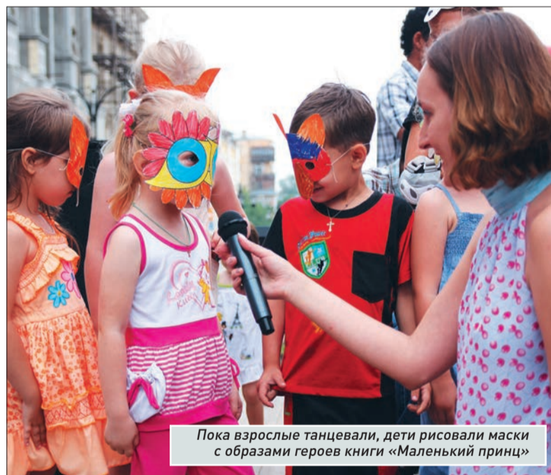
Пока взрослые танцевали, дети рисовали маски с образами героев книги «Маленький принц»