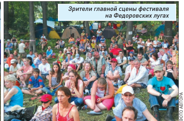
Зрители главной сцены фестиваля на Федоровских лугах

Дорога на Грушинский фестиваль, идущая через дачный массив поселка Федоровка мимо пансионатов «Алые паруса» и «Прометей», в субботу днем оказалась вся в заторах. Машины еле тянулись и едва разъезжались со встречными по разбитой грунтовке с ямами, заполненными водой после пятничного ливня. Приятной неожиданностью стало то, что полицейские подсказывали водителям, как объезжать препятствия, и вообще, вели себя дружелюбно. Около въезда на фестивальную поляну большинство из тех, кто приехал на собственных автомобилях, ждал сюрприз - плата за въезд в размере 800 рублей. Бросить машину рядом не было никакой возможности, все в округе уже было заставлено. Ну что ж... Искусство требует жертв.