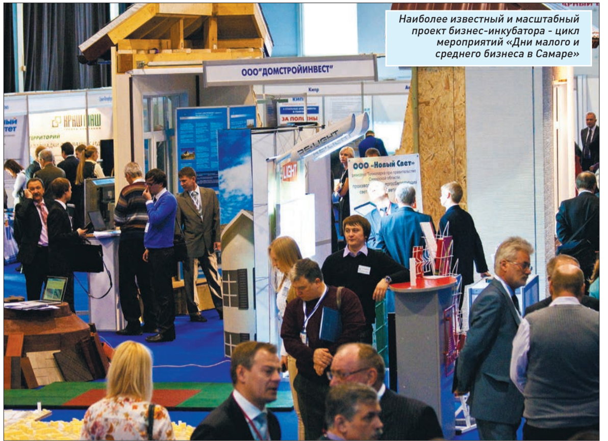
Наиболее известный и масштабный проект бизнес-инкубатора - цикл мероприятий «Дни малого и среднего бизнеса в Самаре»