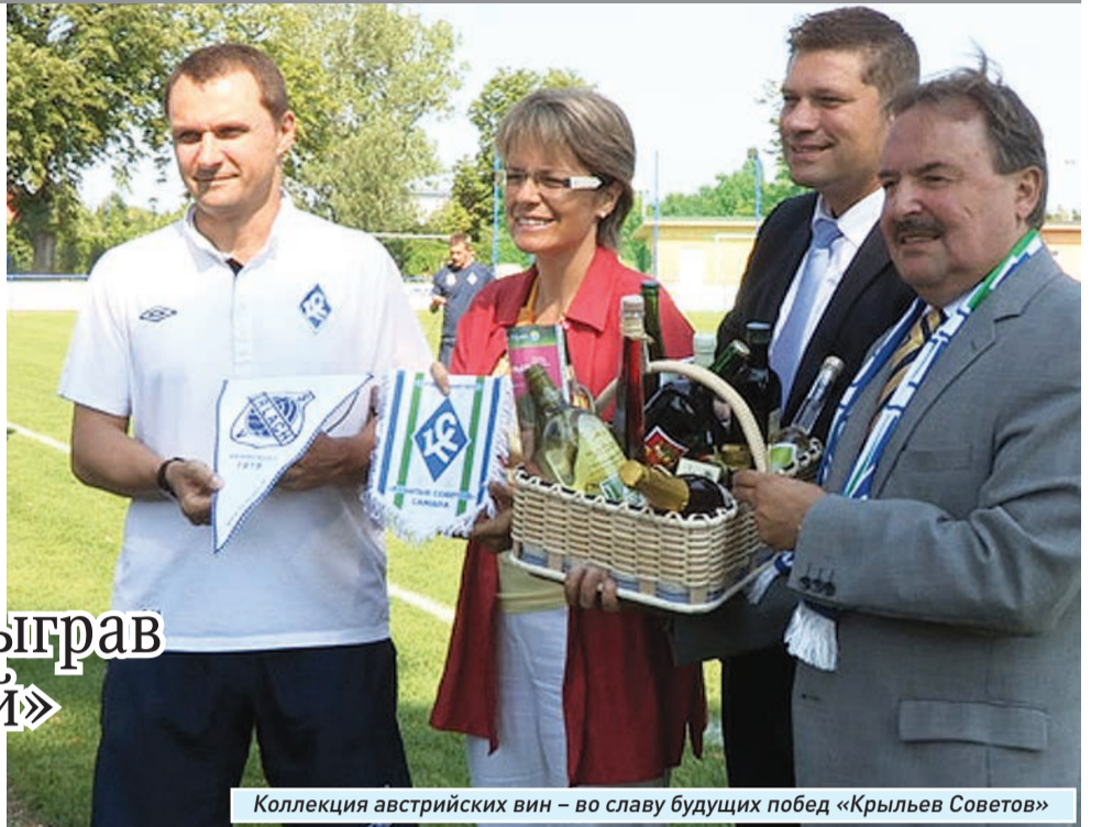
Коллекция австрийских вин – во славу будущих побед «Крыльев Советов»

«Крылья Советов» продолжают тренировочный сбор в Австрии, сыграв два контрольных матча с «Таврией» и «Днепром»