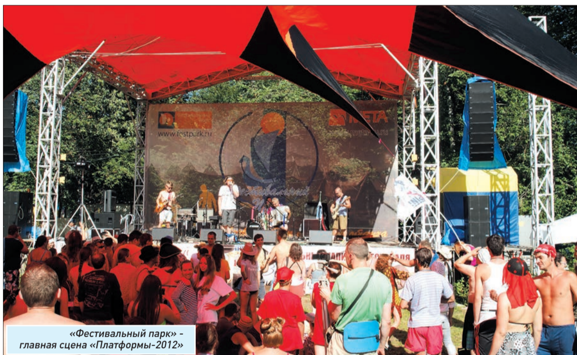
«Фестивальный парк» - главная сцена «Платформы-2012»

На тольяттинской поляне двое полицейских наблюдают за бурными дебатами двух не