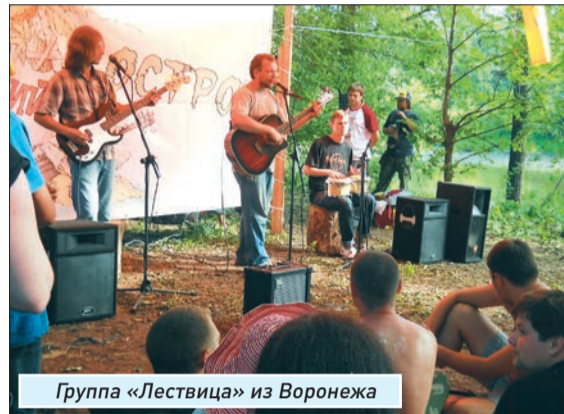
Группа «Лествица» из Воронежа

- Я очень люблю бардовскую песню, знаю ее, и для меня в этом смысле находиться здесь приятно, потому что это мое прошлое и моя молодость.