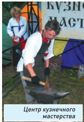
Центр кузнечного мастерства