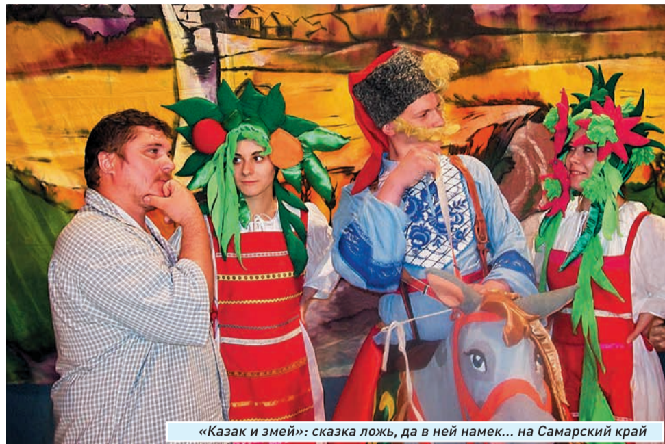
«Казак и змей»: сказка ложь, да в ней намек... на Самарский край

- Да. То, что мы видим с детства, развивает наш вкус, эстетическое восприятие. Ошибка считать, что детей не обманешь и плохое смотреть они не будут. Если с раннего возраста показывать что-то некачественное и говорить, что это хорошо, то ребенок так и будет считать. Поэтому так