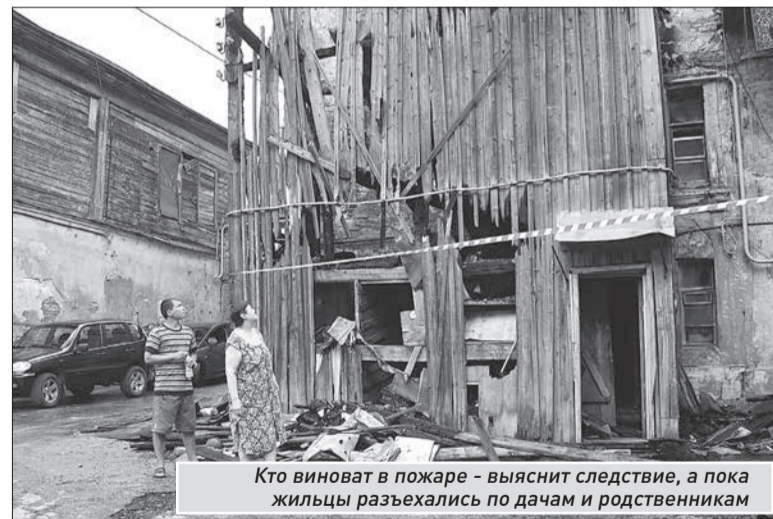
Кто виноват в пожаре - выяснит следствие, а пока жильцы разъехались по дачам и родственникам

Каждому жильцу объяснили, какие документы нужно принести для получения материальной поддержки. Также всем было предложено жилье из маневренного фонда. А для детей пострадавших подготовили бесплатные путевки в оздоровительные лагеря. В идеале, работы по восстановлению планируется завершить за два месяца, до начала холодов. Пока же большинство жильцов разъехались на дачи или разместились у родственников. Четырем семьям будет предложено жилье