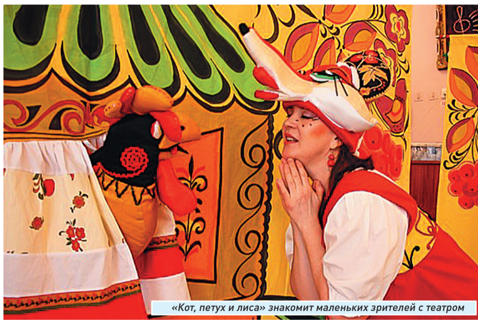
«Кот, петух и лиса» знакомит маленьких зрителей с театром

надо, как будто специально, чтобы развить дурной вкус.