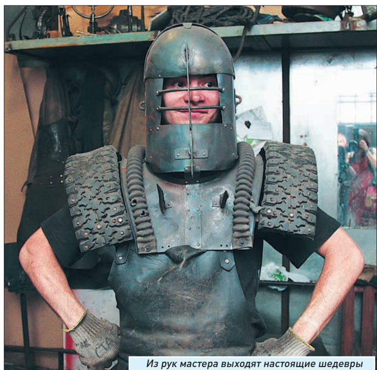
Из рук мастера выходят настоящие шедевры