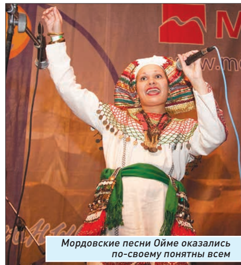
Мордовские песни Ойме оказались по-своему понятны всем

ше некому. Вход на «Метафест» остается условно бесплатным. Это значит, что каждый входящий волен пожертвовать сумму (в этом году - от 100 рублей) на развитие, а на самом деле - чтобы спасти от финансового краха отдельных людей, рискующих собственными деньгами ради привоза еще нескольких хороших музыкантов.