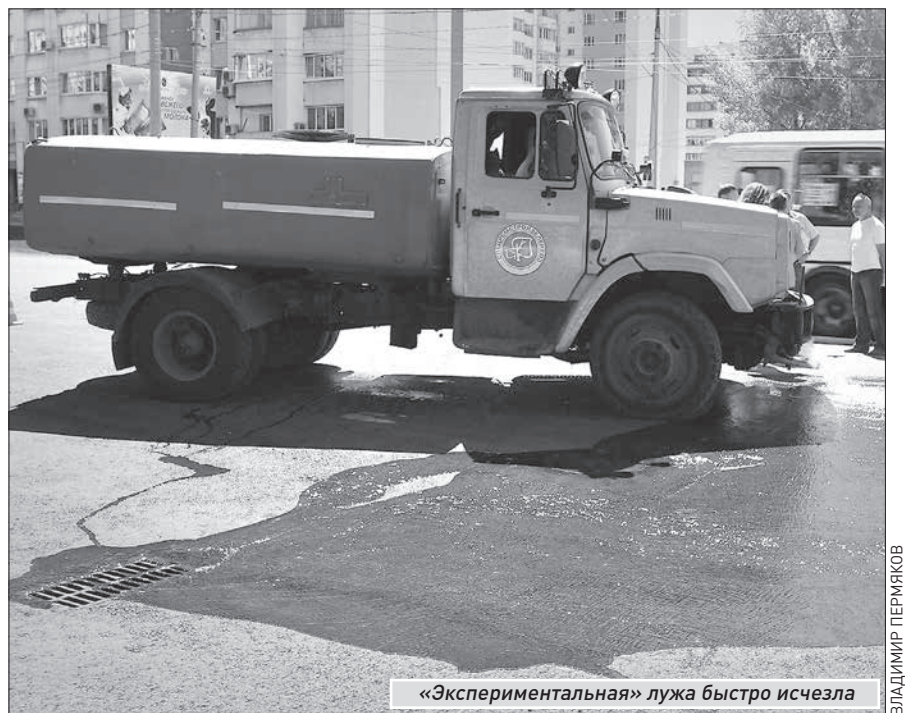
«Экспериментальная» лужа быстро исчезла