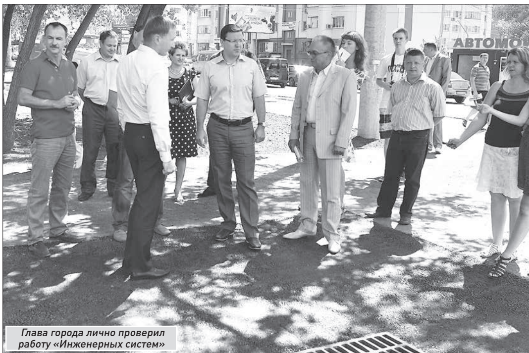
Глава города лично проверил работу «Инженерных систем»