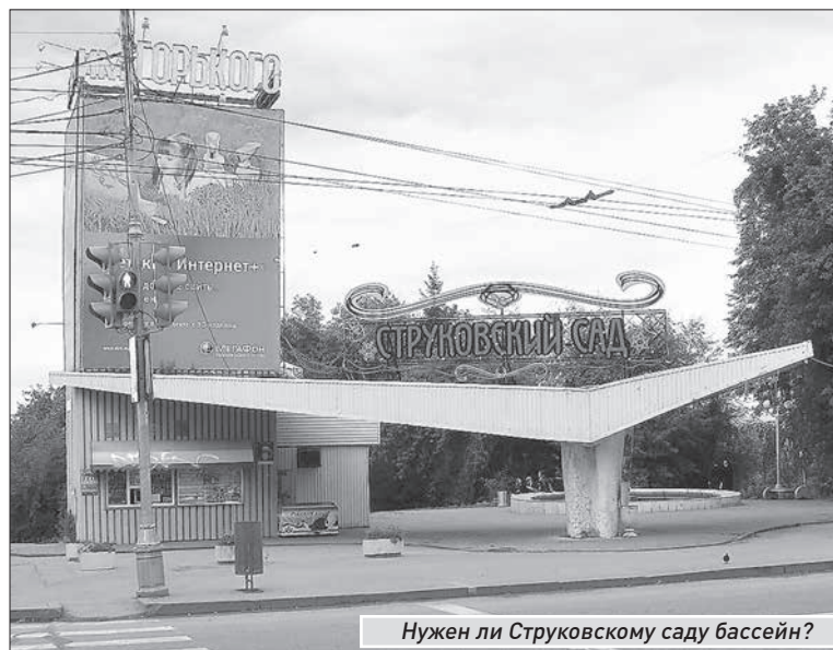
Нужен ли Струковскому саду бассейн?

Еще один объект, который был рассмотрен на слушаниях, - небольшой храм на улице Сол-