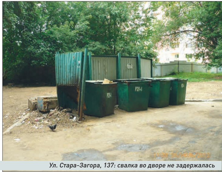
Ул. Стара-Загора, 137: свалка во дворе не задержалась