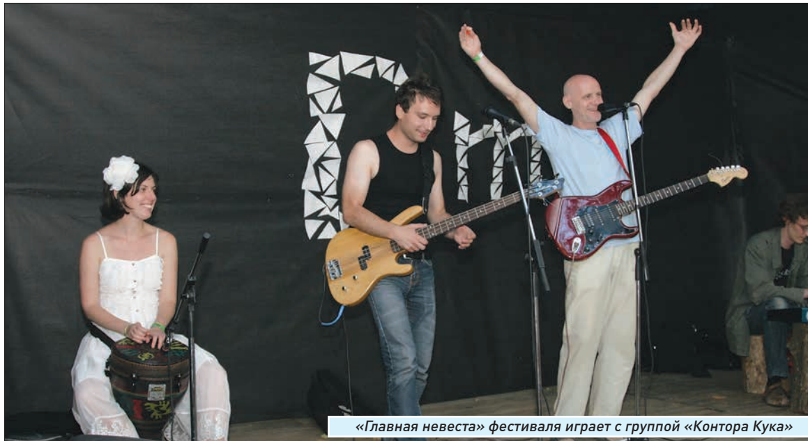
«Главная невеста» фестиваля играет с группой «Контора Кука»