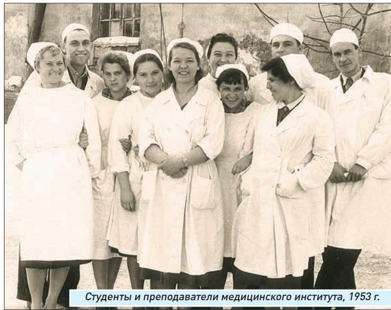
Студенты и преподаватели медицинского института, 1953 г.