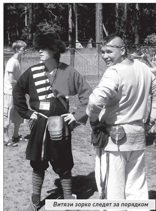
Витязи зорко следят за порядком