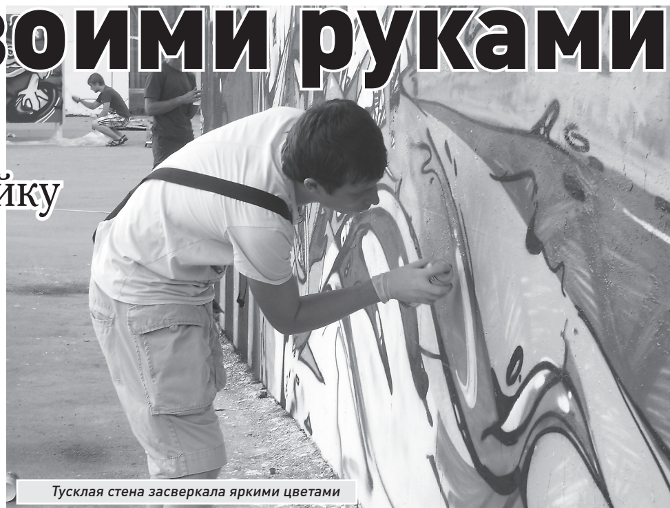
Тусклая стена засверкала яркими цветами