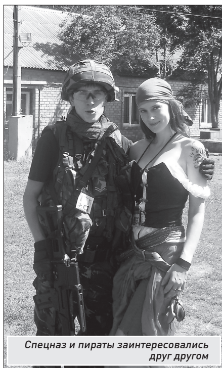
Спецназ и пираты заинтересовались друг другом