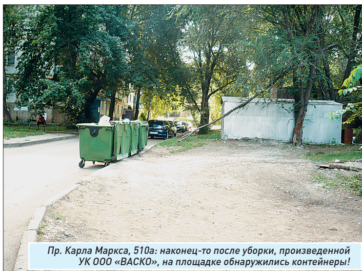
Пр. Карла Маркса, 510а: наконец-то после уборки, произведенной УК ООО «ВАСКО», на площадке обнаружались контейнеры!