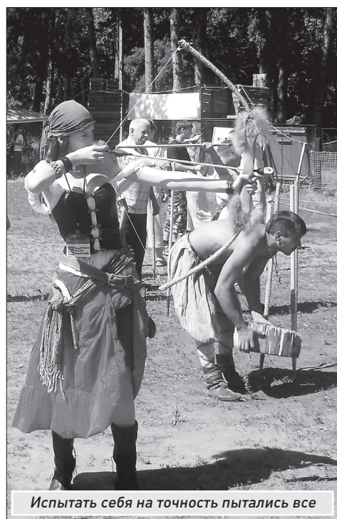
Испытать себя на точность пытались все

Молодежное объединение «Арлонд» и центр молодежной культуры «Мир» при поддержке комитета по делам молодежи тольяттинской мэрии смогли устроить настоящий праздник, совместив интересы людей, увлеченных изучением истории, и поклонников фантастических саг. На отдельной площадке ярмарки можно было купить амулеты от злых духов, боевую трубу из рога африканского быка или даже воссозданный древнерусский боевой щит. Рядом желающие показать богатырскую удалость могли бесплатно и вдоволь посостязаться на специальных дуэльных площадках в битве на пластмассовых алебардах, мечах, булавах. Испытать себя в меткости и ловкости можно было, пометав копьей и боевые ножи или стреляя из лука, на поли-