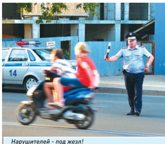
Нарушителей - под жезл!