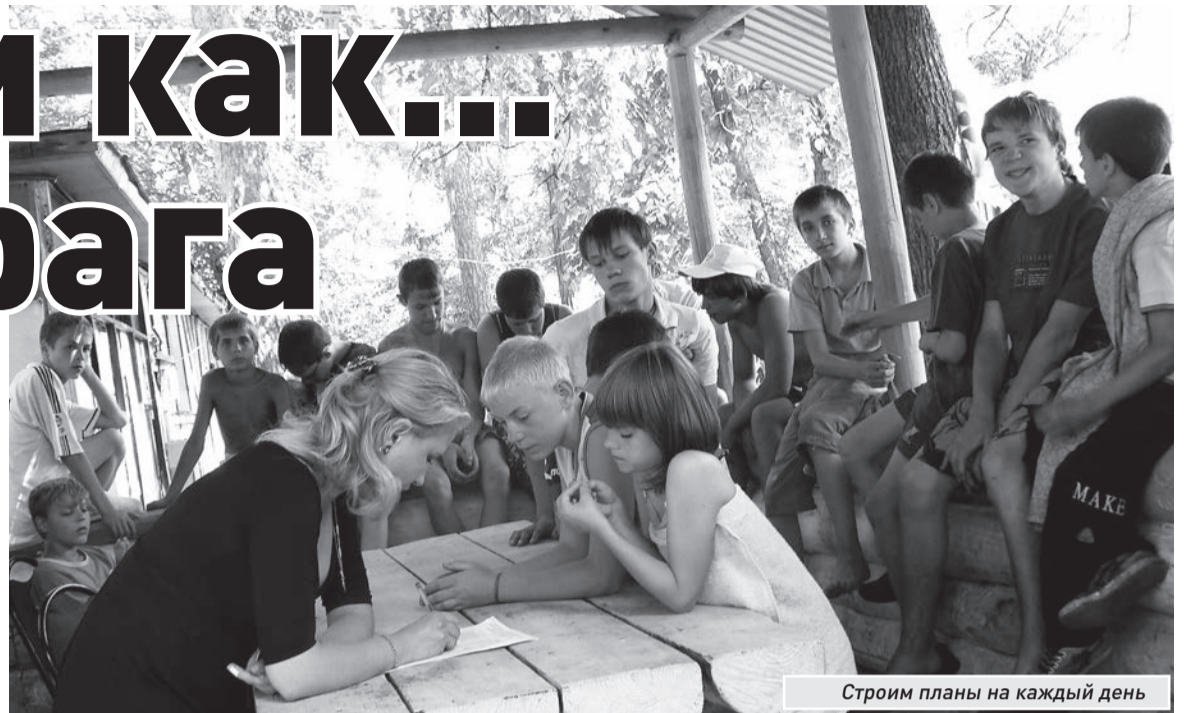
Строим планы на каждый день

- Тогда вместе со всеми мне приходится отступать шагов на двадцать назад и добиваться, чтобы все вместе снова пошли