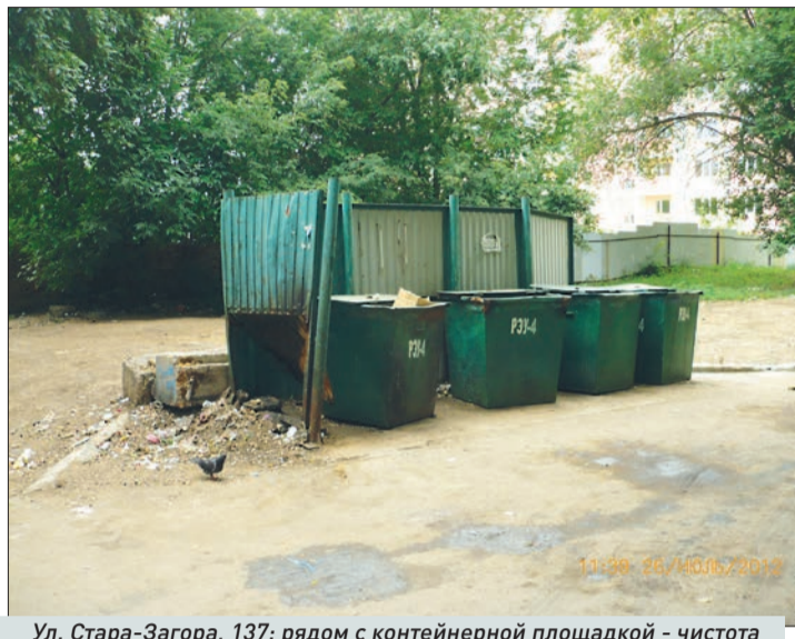
Ул. Стара-Загора, 137: рядом с контейнерной площадкой - чистота