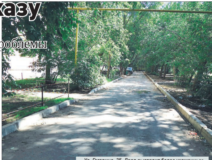
Ул. Гагарина, 35. Двор выглядит более ухоженным

Жители дома 35 по улице Гагарина не раз жаловались на скопление крупногабаритного мусора возле контейнерной площадки. Сами активисты не могут самостоятельно вывезти его на полигон. Между тем чистота и порядок на этом участке очень важны для них. Горожане по собственной инициативе разбивают клумбы под своими окнами, ухаживают за цветами. Тем не менее строительный мусор от неизвестных «доброжелателей» периодически появляется на этой территории. Но после обращения в «СГ» отходов становится меньше. То же самое касается уборки двора. Теперь он выглядит более чисто и аккуратно. На внутриквартальной дороге порядок. Жители довольны работой дворников.