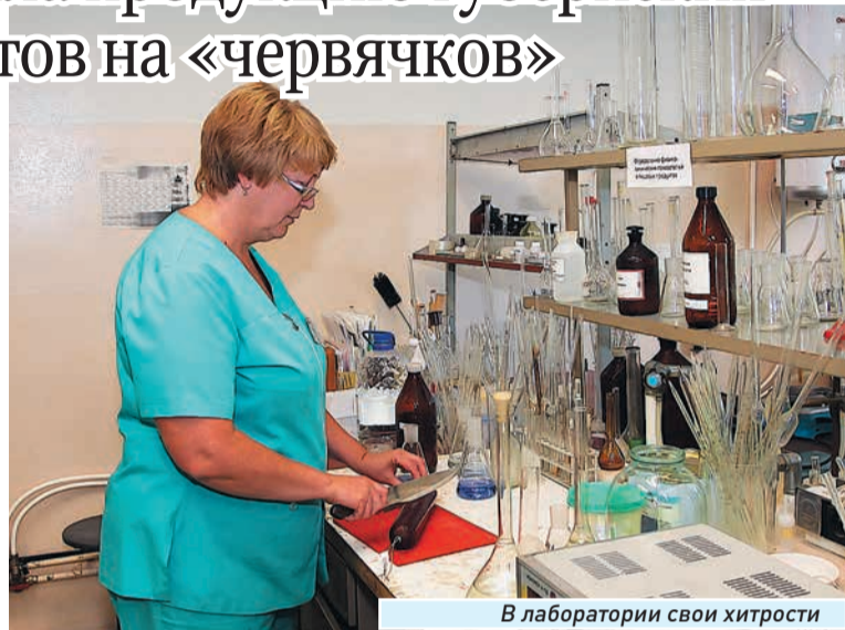
В лаборатории свои хитрости

С другой стороны, у колбасы подпорчена репутация. Насмотрись передач, послушаешь народ, и колбаска не мила становится. И делают ее в грязи, в помещениях с крысами и тараканами, добавляют красители для цвета, а