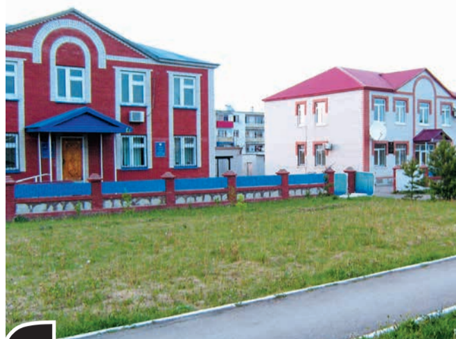
Пока в Самарском «Белом доме» рассматривают письмо эсеров, в Клявлино все спокойно