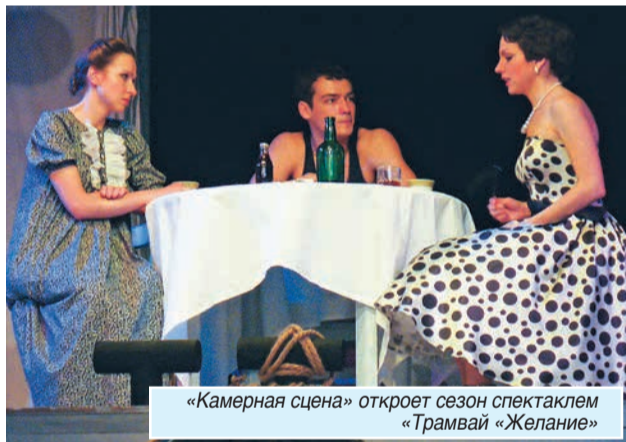
«Камерная сцена» откроет сезон спектаклем «Трамвай «Желание»