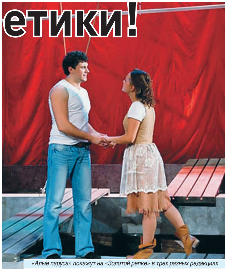
«Алые паруса» покажут на «Золотой репке» в трех разных редакциях

В конце сентября поклонников филармонии ожидает VI Международный фестиваль органной музыки «Королевские ау-