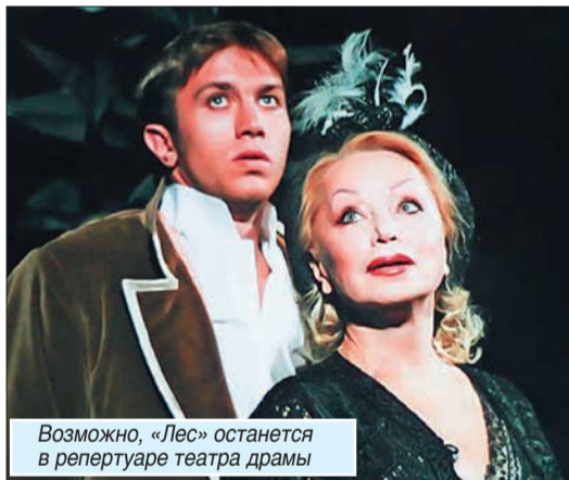
Возможно, «Лес» останется в репертуаре театра драмы

1 сентября, в день открытия сезона, зрители увидят премьеру спектакля «Радужная рыбка». Это постановка директора и режиссера Театра «Ам Ольгаеск» Нелли Айхорн, Штутгарт).