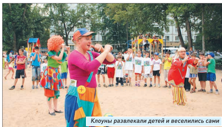
Клоуны развлекали детей и веселились сами

- Какую все-таки полезную программу разработали, - рассуждали между собой две бабушки интеллигентного вида, чьи внуки лет пяти катались на новеньких качелях, - и правильно сделали, что все это в рамки конкурса облачили. И жители теперь сами инициативу проявляют, проекты придумывают, а главное - потом обязательно будут все это добро