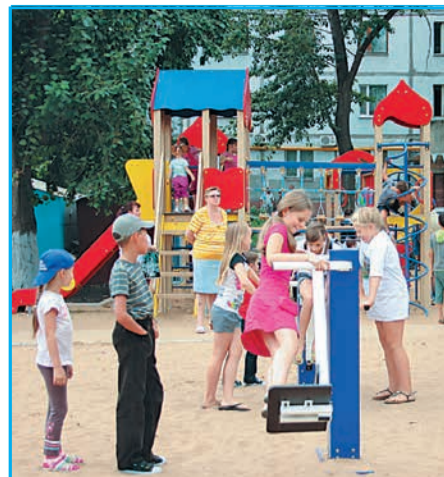
На новую спортплощадку в Самаре собрались взрослые и дети со всего микрорайона стр. 3