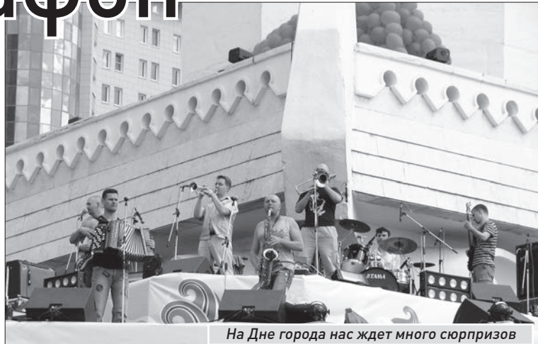
На Дне города нас ждет много сюрпризов