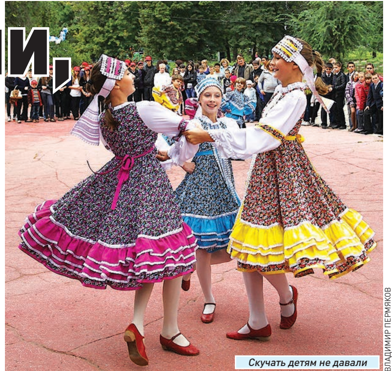
Скучать детям не давали

Педагоги развлекали юных непосед как могли: для мальчишек-богатырей были проведены силовые конкурсы, для девочек - состязания на ловкость. Кроме