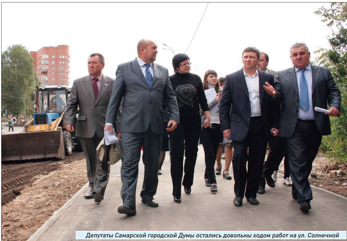
Депутаты Самарской городской Думы остались довольны ходом работ на ул. Солнечной

Депутаты интересовались и тем, как обстоят дела с комфортом для маломобильных граждан. Выяснилось, что для инвалидов-колясочников на спуске около дома № 19 по улице Шверника предусмотрен пандус. Также представители рабочей группы заметили, что к расположенным вдоль дороги магазинам и учреждениям нет никаких специальных проездов. «Проводилась ли какая-то работа в этом на-