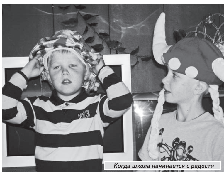
Когда школа начинается с радости