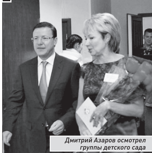
Дмитрий Азаров осматривает группу детского сада

- Детский сад замечательный. Это хороший пример системного сотрудничества бизнеса и власти, - отметил Дмитрий Азаров . - Мы со своей стороны выделяем средства из городского бюджета на каждого ребенка, посещающего билдинг-сады, в том же объеме, что и на детей из муниципальных дошкольных учреждений. В этом году благодаря развитию этого проекта мы планируем открыть более тысячи дополнительных мест для самарских детей.