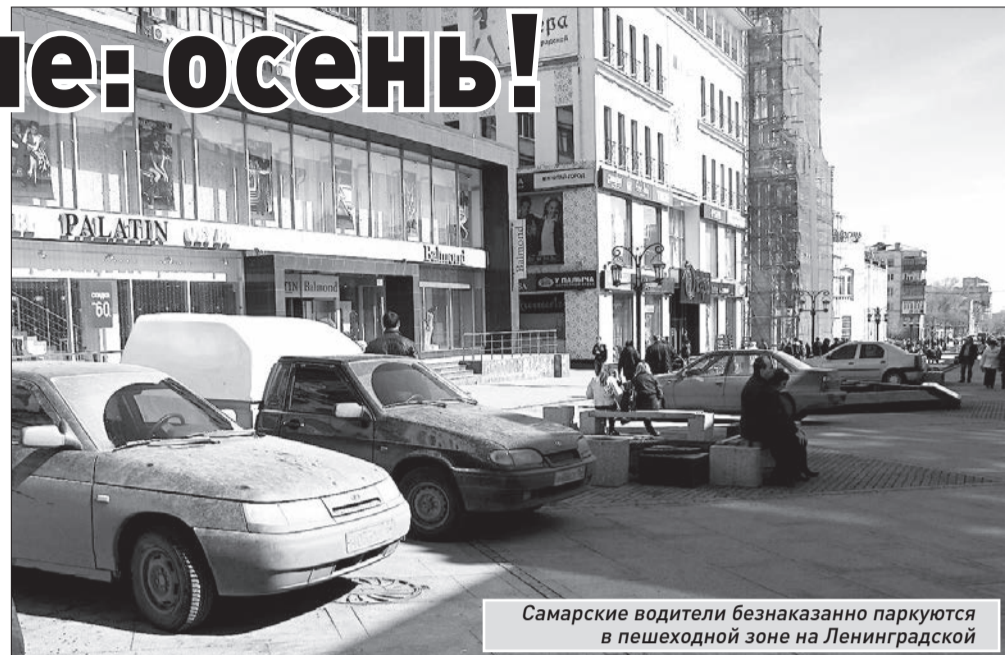
Самарские водители безнаказанно паркуются в пешеходной зоне на Ленинградской

Также мэр напомнил, что был разговор об установке здесь ограждений для препятствия доступа на пешеходную зону автомобилей. «Когда это будет сделано?» - спросил он. «Мы направляли вам письмо со схемой