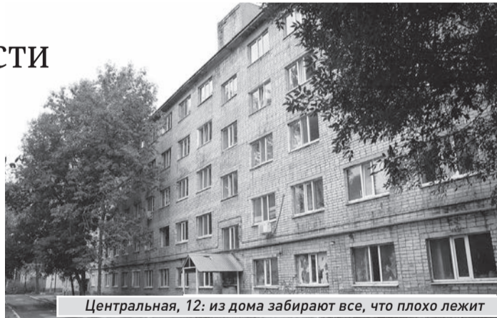
Центральная, 12: из дома забирают все, что плохо лежит