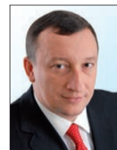
АЛЕКСАНДР ФЕТИСОВ председатель Думы городского округа Самара:

- В нашем городе не хватает зеленых зон. Это очевидно. Сегодня наша задача заключается в том, чтобы сохранить имеющиеся парки, скверы и зеленые бульвары, а также содействовать созданию новых рекреационных зон. Наличие долгосрочной и конкретной программы позволит поступательно двигаться к этой цели, планировать и эффективно задействовать ресурсы. То же касается и реновации исторической части. Город должен развиваться гармонично, не теряя при этом своего облика. Нам было важно получить одобрение жителей города, поэтому оба эти проекта мы вынесли на столь широкое обсуждение.