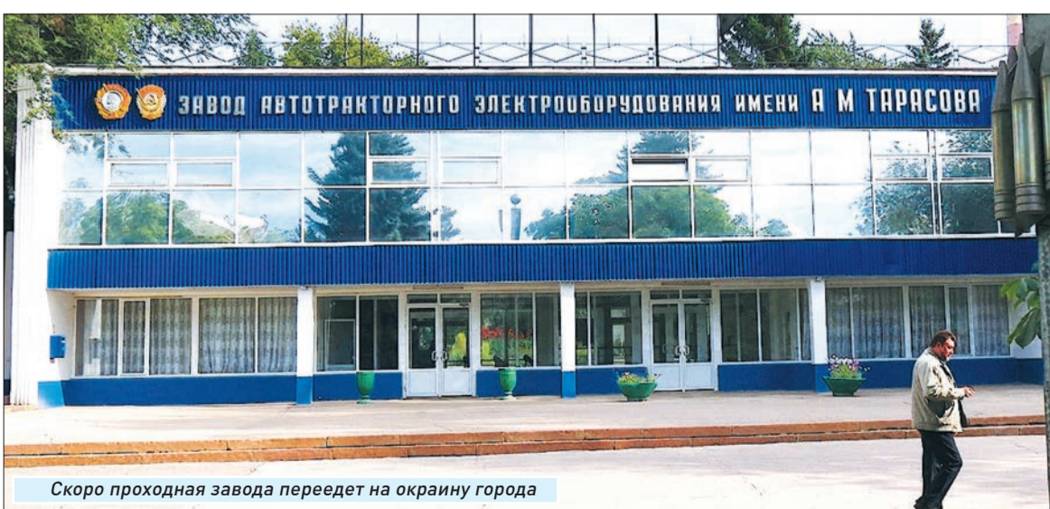
Скоро проходная завода переедет на окраину города