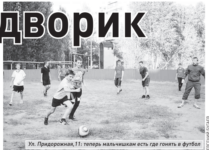
Ул. Придорожная, 11: теперь мальчишкам есть где гонять в футбол

Разноцветные шарик, накрытый стол, радостно гомоня-