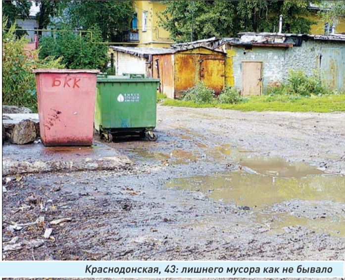
Краснодонская, 43: лишнего мусора как не бывало