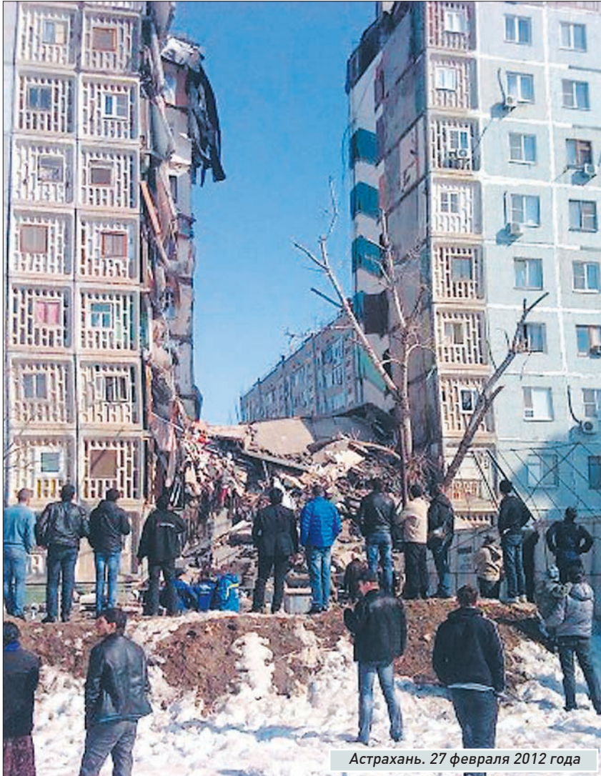
Астрахань. 27 февраля 2012 года

СМИ заполнили информацией о взрывах бытового газа в жилых домах. Страдает имущество, страдают и люди. Один из самых шумевших случаев начала года - обрушение подъезда многоквартирного дома в Астрахани. Тогда погибло 11 человек. К сожалению, «черный список» продолжает и наш регион. Так, в Чапаевске в конце февраля от отравления угарным газом погиб пенсионер, а в апреле в поселке Красный Кряжок по той же причине чуть не умер трехлетний малыш. Еще в одном из городов области двое мальчишек, делавших вместе уроки, погибли из-за продуктов сгорания голубого топлива. Всего за прошедший период текущего года в губернии отравилось или пострадало от взрывов бытового газа почти 90 человек.