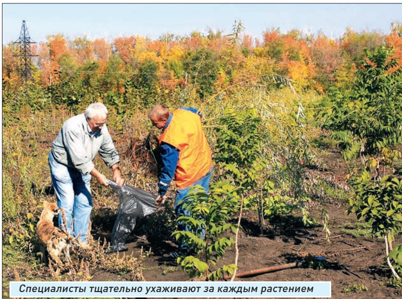
Специалисты тщательно ухаживают за каждым растением

«Учится» юное деревце несколько лет (хвойные сорта - от 10 лет, березки - четыре-пять, рябина - шесть). Каждый ствол, каждый кустик - а их тут много тысяч - требует особого ухода.