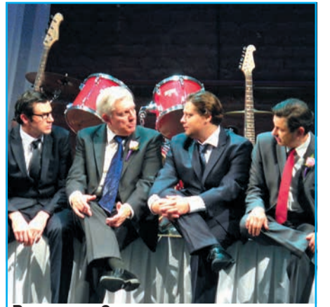
В театре «Самарская площадь» - премьера спектакля «Тестостерон» по пьесе Анджея Сарамоновича.