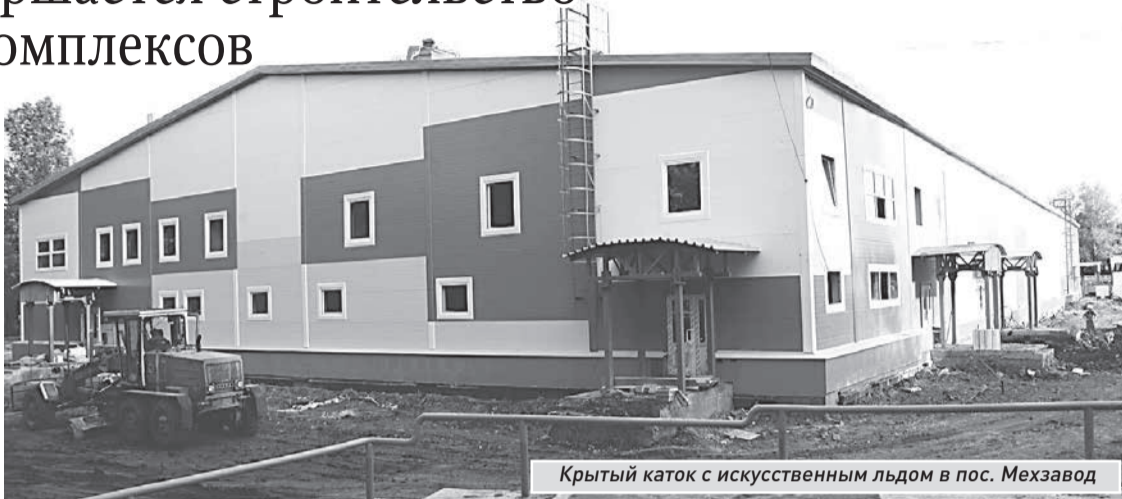
Крытый каток с искусственным льдом в пос. Мехзавод

Первая площадка, которую посетил мэр, расположена на ул. Аэродромной в районе дома №13. В мае 2013 года здесь планируется открыть спортивно-оздоровительный комплекс с условным названием «Динамо». Как пояснили представители генподрядчика ООО «Русич», объект готов на 99%. Остается только благоустроить территорию. Этим занимается муниципальное предприятие «Спецремстройзеленхоз». На первом этаже комплекса разместятся раздевалки и душевые, на втором - тренажеры, залы укрепляющей физкультуры и силовой атлетики, на третьем