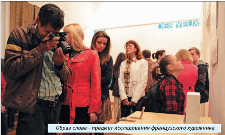
Образ слова - предмет исследования французского художника

Необычно, ярко и «ест» что поразглядывать» - к таким словам можно свести комментарии тех, кто пришел на открытие. Собственными глазами убедиться, что l'ART est partout (искусство есть повсюду), как утверждает один из экспонатов, можно до 26 сентября в Самарском литературном музее (усадьба Алексея Толстого, ул. Фрунзе, 155).