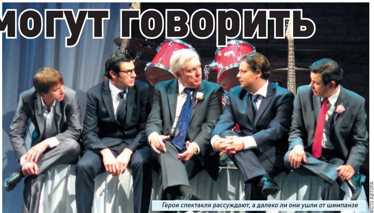
Герои спектакля рассуждают, а далеко ли они ушли от шимпанзе