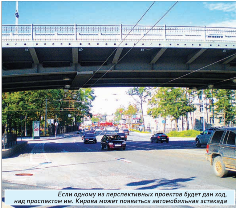
Если одному из перспективных проектов будет дан ход, над проспектом им. Кирова может появиться автомобильная эстакада

В районе дома № 44 по ул. Ново-Садовой специальные места, предназначенные для парковки транспорта, отсутствуют. Стоящие непосредственно на проезжей части машины исключают возможность для прохождения крайнего правого ряда. А это в свою очередь приводит к необоснованным задержкам в движении транспорта. Соответственно, дорожный знак «Стоянка запрещена» применен здесь обоснованно.