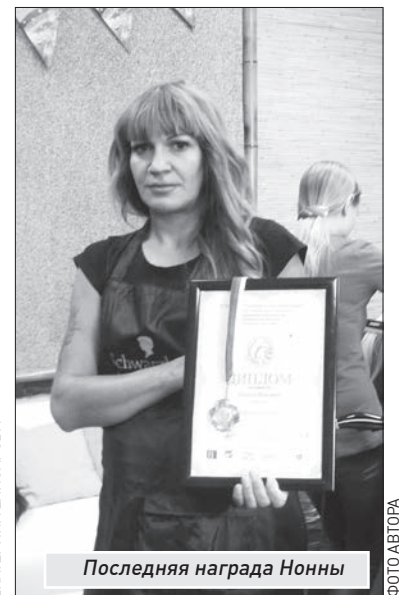
Последняя награда Нонны