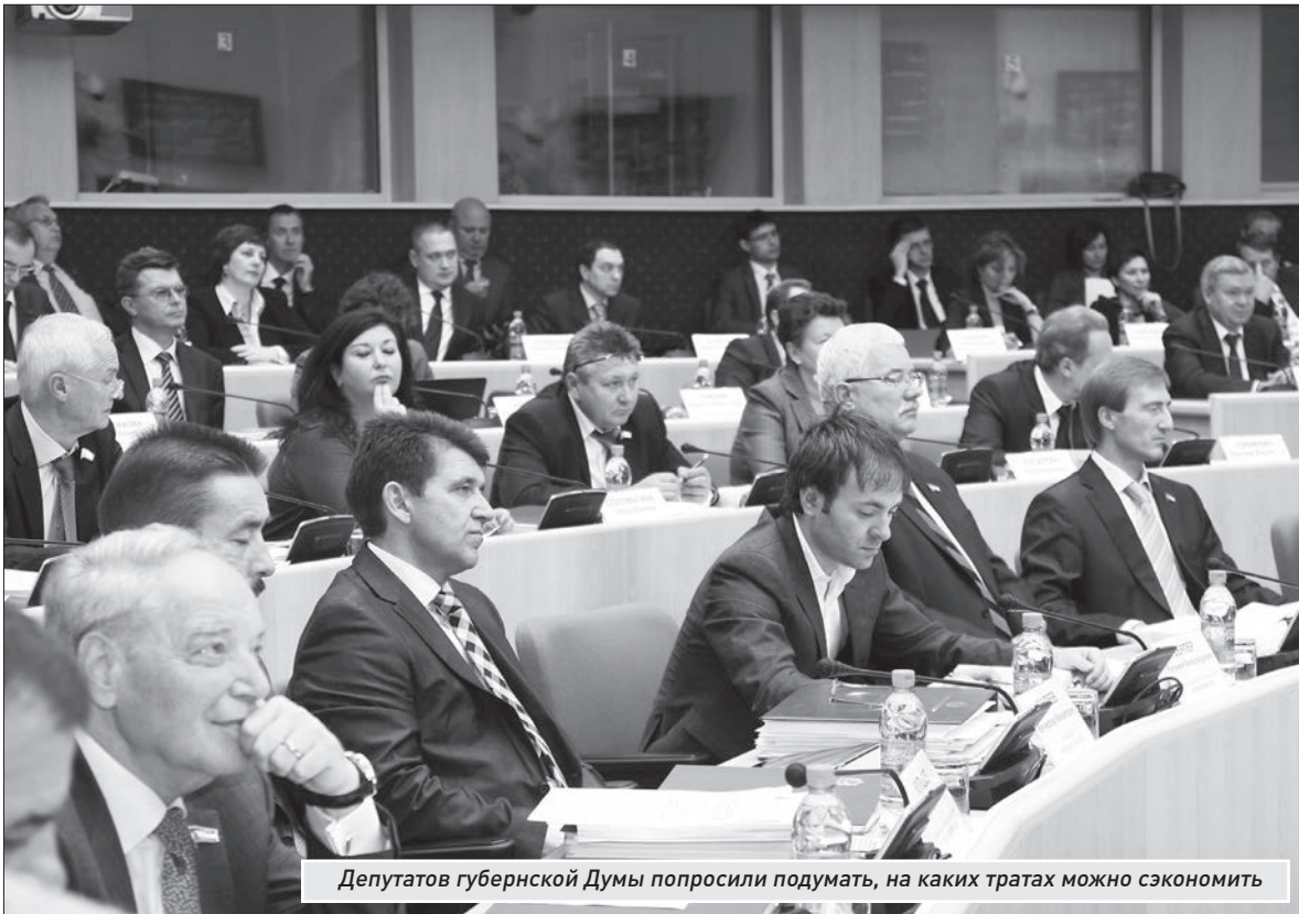
Депутатов губернской Думы попросили подумать, на каких тратах можно сэкономить

| На заседании облдумы губернатор выступил с сенсационным заявлением