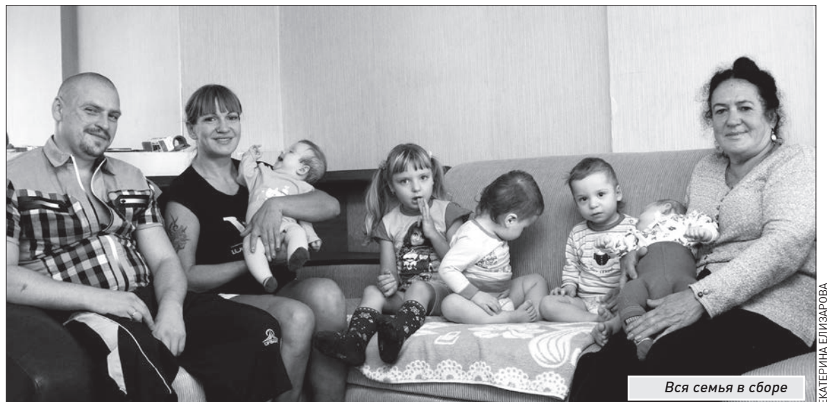
Вся семья в сборе