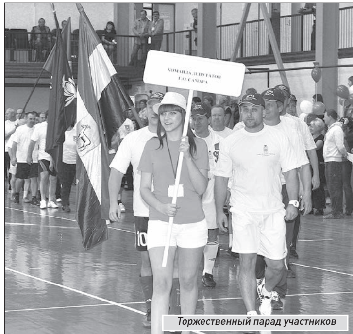
Торжественный парад участников

Самарскую команду из 20 депутатов вел на торжественное построение, а затем и в «бой» спи-