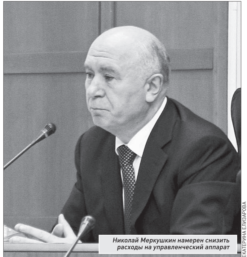
Николай Меркушкин намерен снизить расходы на управленческий аппарат