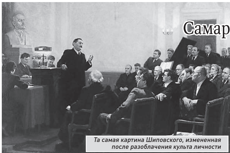
Та самая картина Шиповского, измененная после разоблачения культа личности