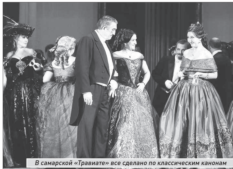
В самарской «Травиате» все сделано по классическим канонам

Для глаз сделано, действительно, много. Чего стоят только 200 костюмов художника Натальи Земалиндиной - практически все ручной работы. Декорации художника-постановщика Елены Соловьевой работают скорее на то, чтобы не отвлекать внимание от исполнителей. Полноценным участником действия становятся только при помощи юпитеров. Например, противопоставление светлой сцены на балу в первом действии, где и костюмы, и освещение, и декорации наполнены ожиданием люб-