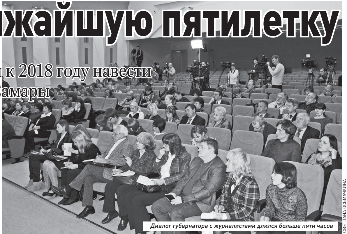
Диалог губернатора с журналистами длился больше пяти часов

В первую очередь это касается нового стадиона, который должен появиться на стрелке рек Волги и Самары. Правда, глава региона заметил, что некоторые расчеты,