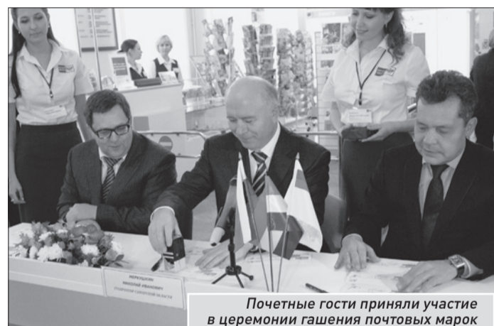
Почетные гости приняли участие в церемонии гашения почтовых марок