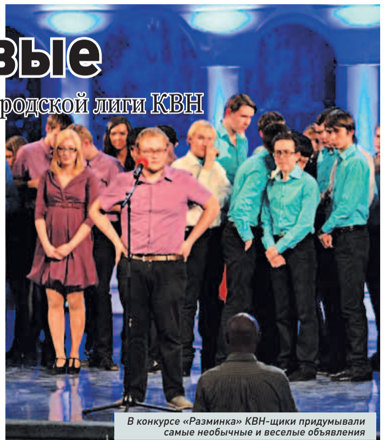
В конкурсе «Разминка» КВН-щики придумывали самые необычные и веселые объявления

Особо хочется отметить выступление команды «Обратная связь» в заключительном конкурсе «Игра в игре», где все команды представляли мини-сценки, в которые должны были включить специально заготовленное видео. Ребята показали квартиру, где бу-