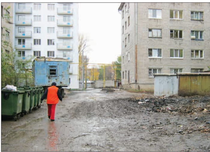
Подготовила Алена СЕМЕНОВА

Жители дома № 66 по ул. Николая Панова не раз высказывали недовольство состоянием своего двора. Это и неудивительно. Здесь постоянно скапливался мусор. На внутриквартальной дороге валялись пакеты из-под фаст-фуда, пивные банки, обертки. Неужоженный вид территории совсем не радовал глаз. А недавно у контейнерной площадки выросла огромная гора мусора. К обычным отходам присоединились картонные коробки, доски и обломки мебели. К счастью, люди недолго «любовались» этим безобразием. По предписанию городской административно-технической инспекции по благоустройству во дворе оперативно навели порядок. Лужи остались, но свалки больше нет.