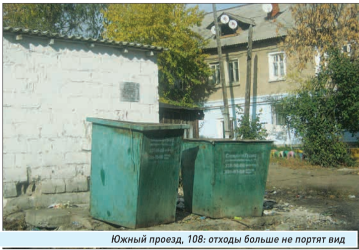
Южный проезд, 108: отходы больше не портят вид