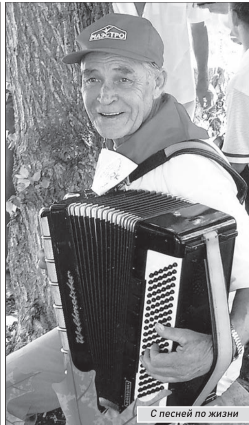
С песней по жизни