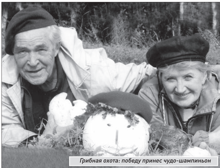
Грибная охота: победу принес чудо-шампиньон