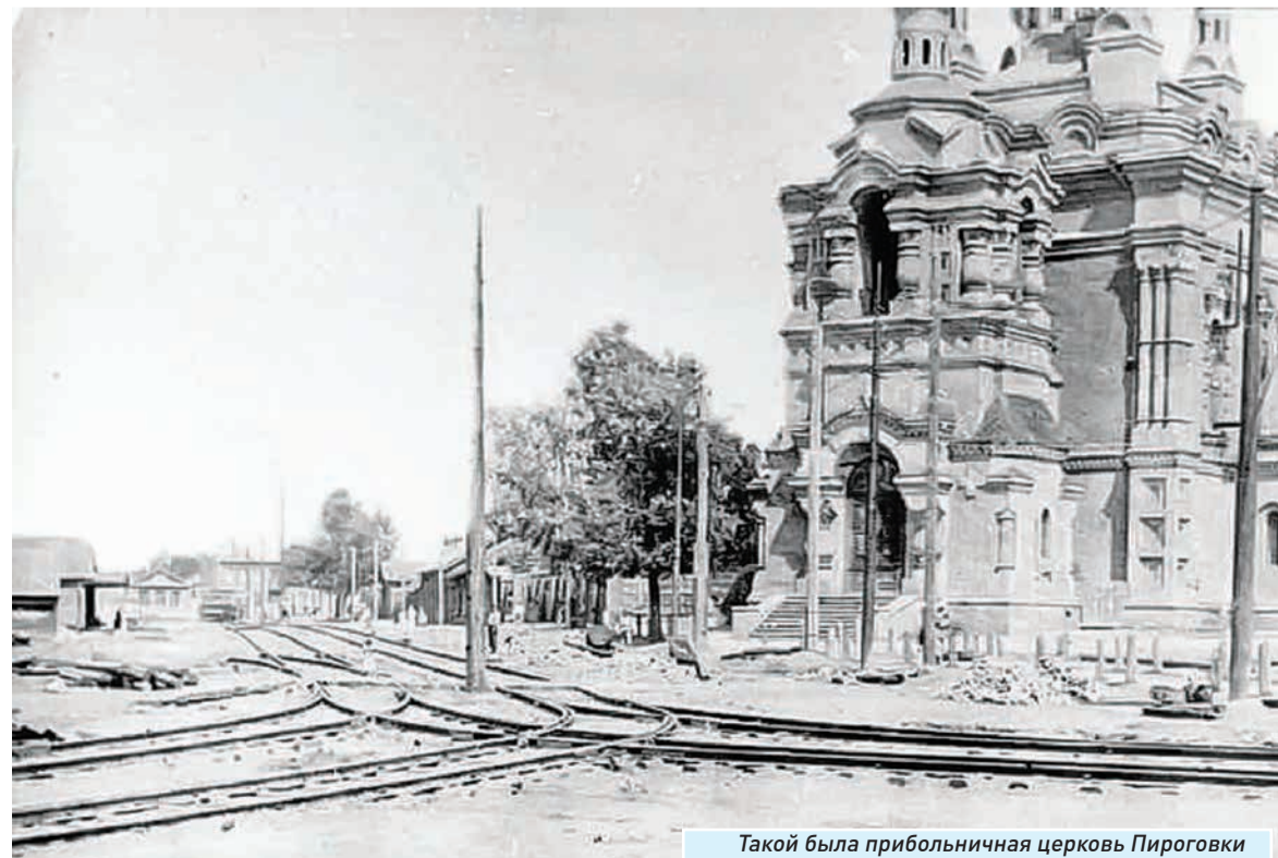
Такой была прибольничная церковь Пироговки

Я деликатно покашляла, поскольку была хорошо воспитана, и сказала: