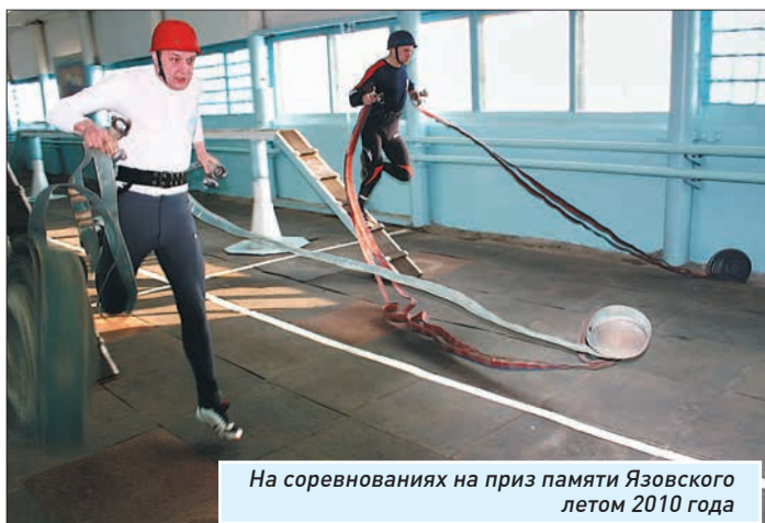
На соревнованиях на приз памяти Язовского летом 2010 года

Закончившим же свою спортивную карьеру спортсменам нет необходимости ломать голову над тем, чем заниматься дальше. У них в руках надежная мужская профессия.