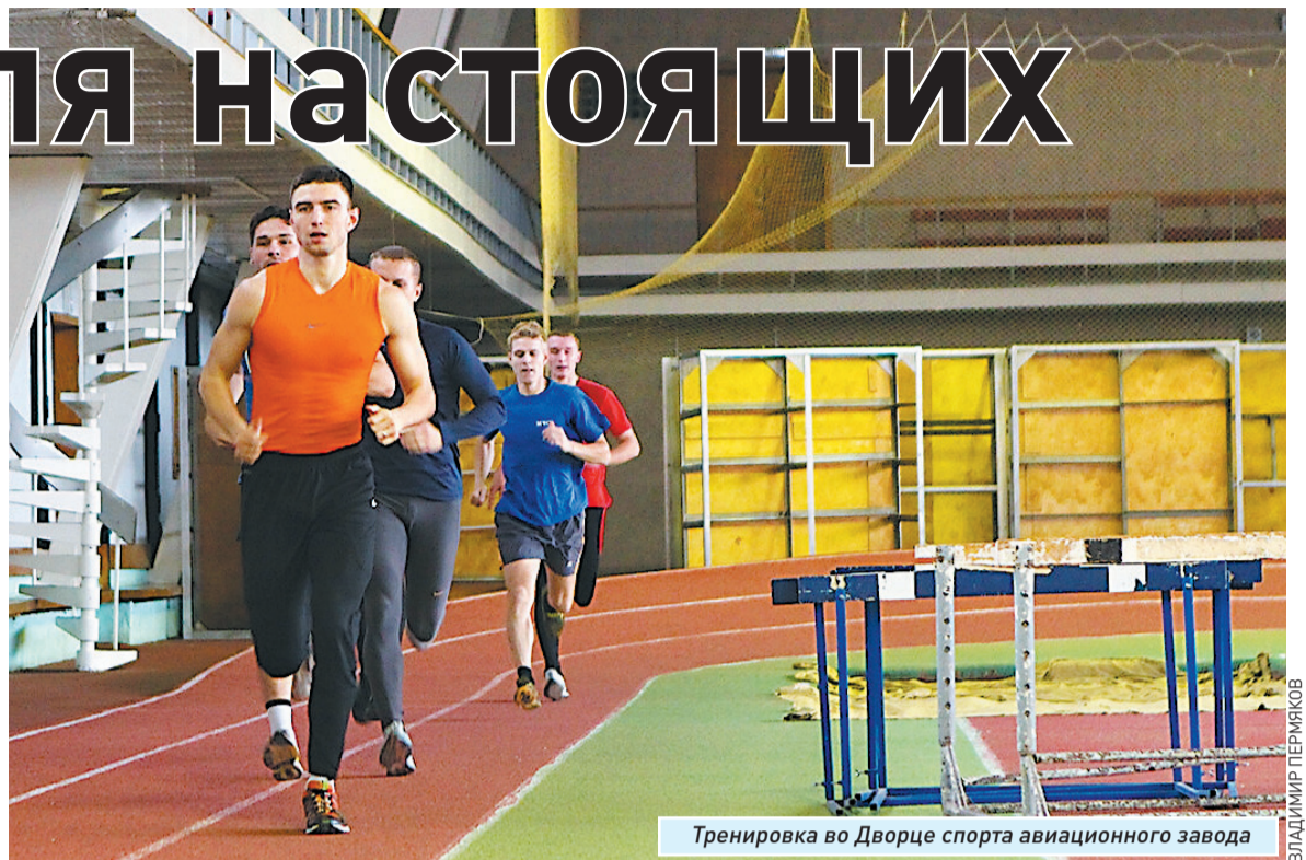
Тренировка во Дворце спорта авиационного завода