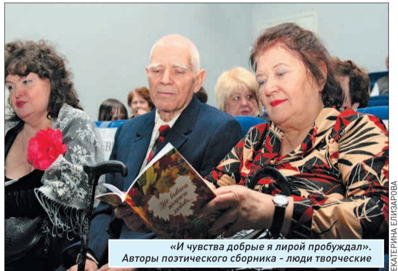
«И чувства добрые я лирой пробуждал». Авторы поэтического сборника - люди творческие

И сейчас, как в молодости, эти люди пишут стихи и песни, исполняют их со сцены, сами шьют концертные костюмы. А главное, свою любовь несут лю-