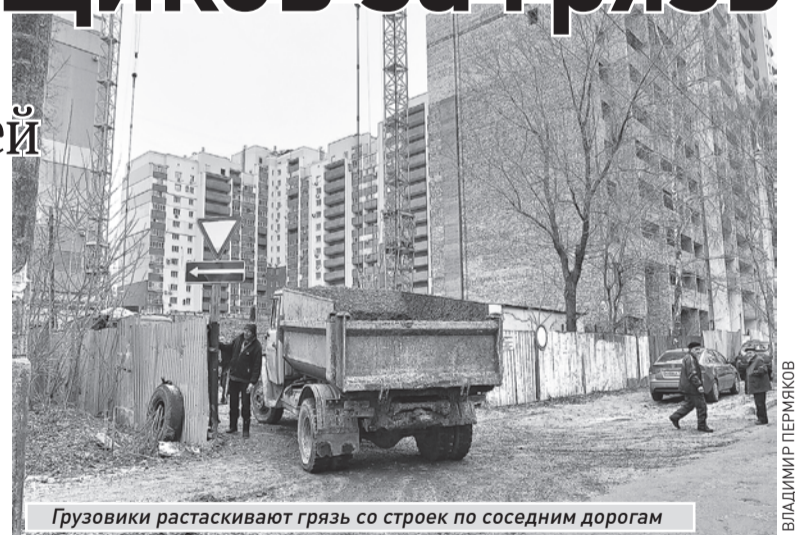
Грузовики растаскивают грязь со строек по соседним дорогам