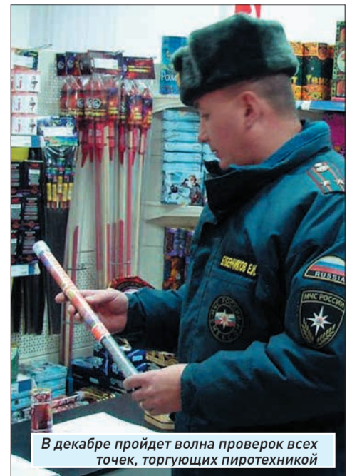
В декабре пройдет волна проверок всех точек, торгующих пиротехникой

Некоторые детали противопожарной безопасности удивили собравшихся. Например, постановление правительства № 390 «О противопожарном режиме», положения которого запрещают использовать удлинители, в том числе и обычные «пилоты», в которые включается вся оргтехника. Как тогда «гореть» елочке? Выход есть. Вместо привычных приборов рекомендовано использовать сетевые фильтры. Но