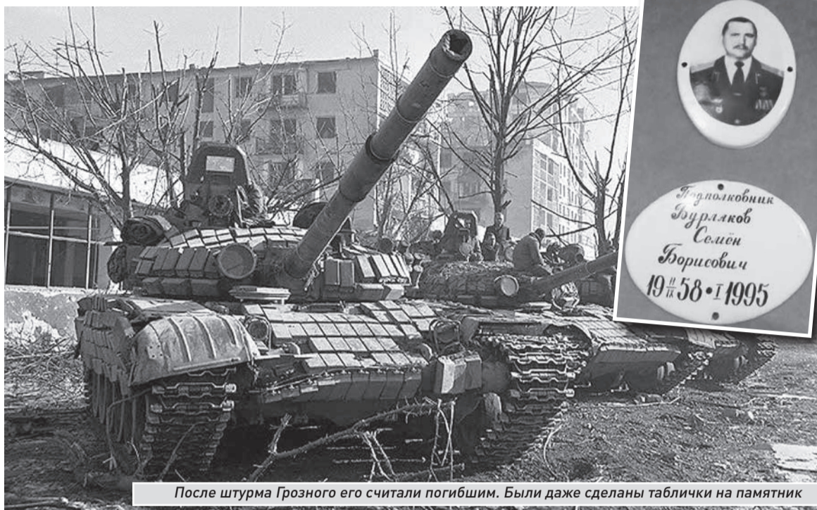
После штурма Грозного его считали погибшим. Были даже сделаны таблички на памятник

Неожиданно 14 декабря в еще «сырой» полк пришел новый приказ: срочно грузиться и отправляться в Моздок. На все давалось несколько суток. В результате события стали развиваться по самому наихудшему варианту. Командиры младшего звена (от отделения до роты) не успели изучить своих подчиненных (сделали они это лишь