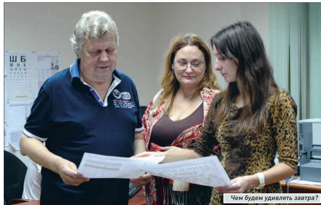
Чем будем удивлять завтра?

Но больше всего мне дороги истории, когда удается помочь людям, оказавшимся в очень непростых ситуациях. Слава богу, их немало. Хорошая у нас профессия.