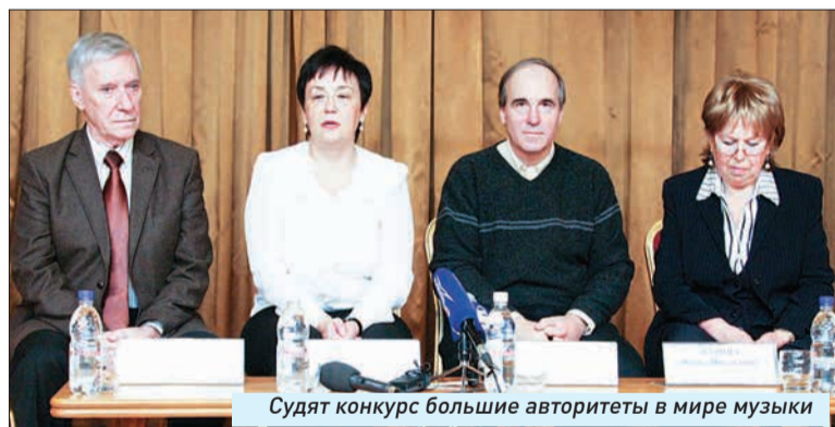
Судят конкурс большие авторитеты в мире музыки