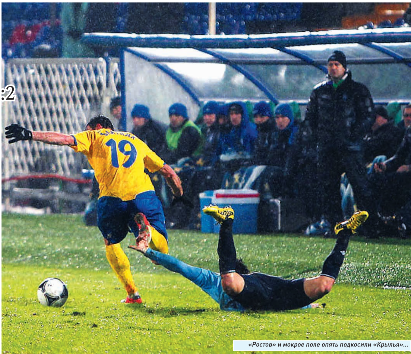
«Ростов» и мокрое поле опять подкосили «Крылья»...

Теперь уже ясно, что «Крыльям» по весне уготована изнурительная и тяжелейшая борьба за выживание в премьер-лиге. Такая вот печальная традиция.