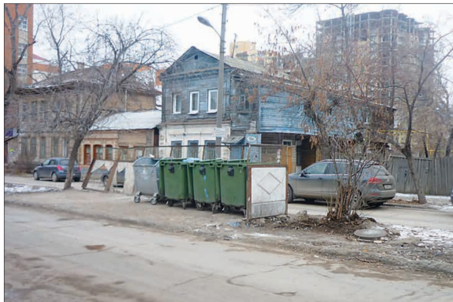
Подготовила Алена СЕМЕНОВА

Рядом с домом № 95 по ул. Ленинской на контейнерной площадке образовалась настоящая свалка. Видимо, кто-то из жильцов делал ремонт, а хлам вынес на тротуар. Обломки мебели, доски и ящики не украшали территорию. К тому же к контейнерам стало не подойти! «Предприимчивые» жильцы решили проблему просто - бросали мусор неподалеку, не доходя до баков. Но сейчас, к счастью, ситуация изменилась. По поручению городской административно-технической инспекции по благоустройству на контейнерной площадке навели порядок. Обслуживающая организация вывезла отходы на полигон.