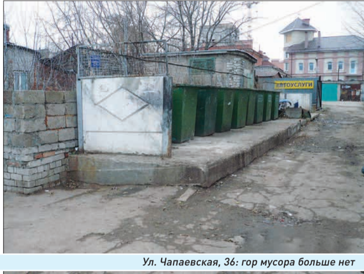
Ул. Чапаевская, 36: гор мусора больше нет