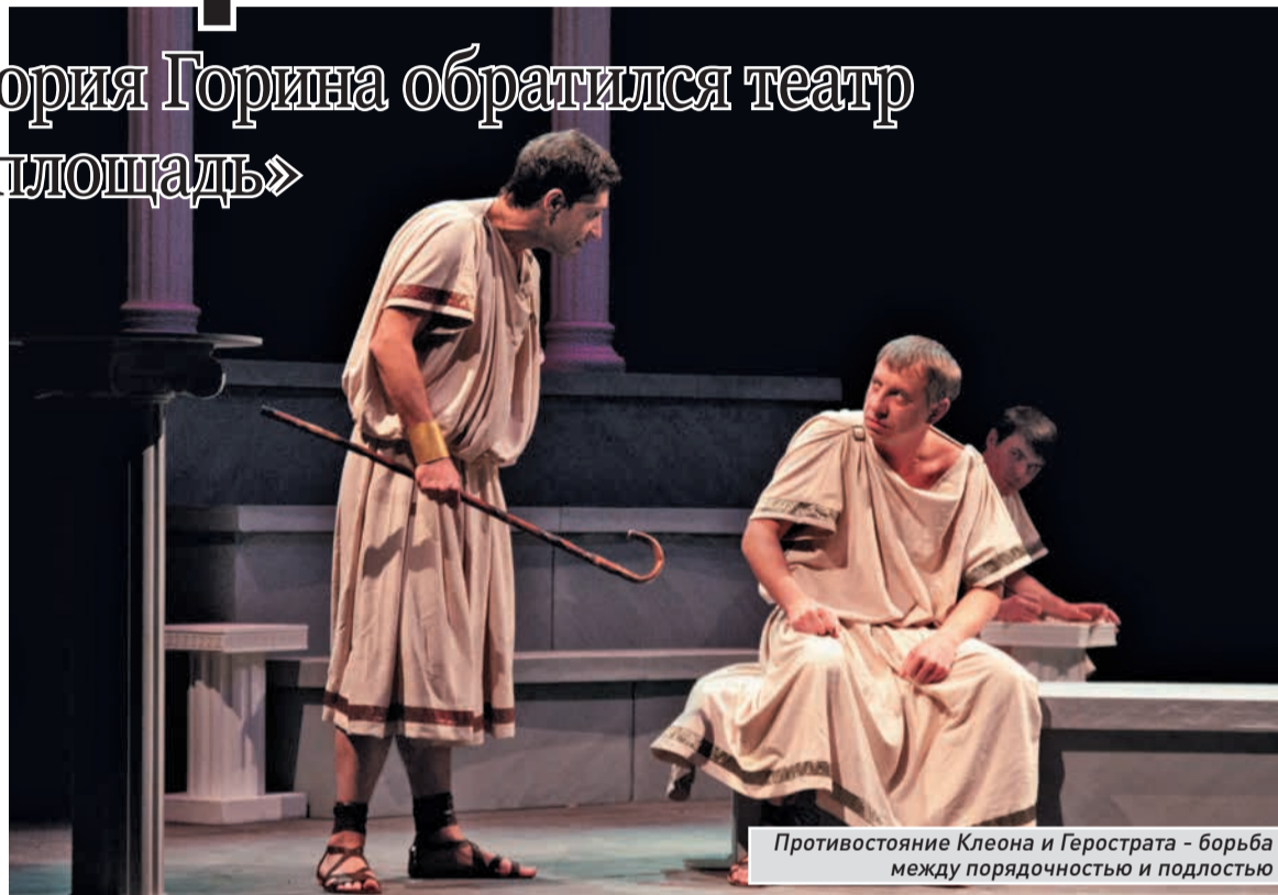
Противостояние Клеона и Герострата - борьба между порядочностью и подлостью

Первым на путь «преступного забывания» встал историк Феопоп, сохранивший имя его для потомков. Усилил интерес к недостойному наш современник - драматург Григорий Горин . Пьеса «Забыть Герострата!», написанная в 1972 году, имеет не самую богатую сценическую историю, однако Самара теперь