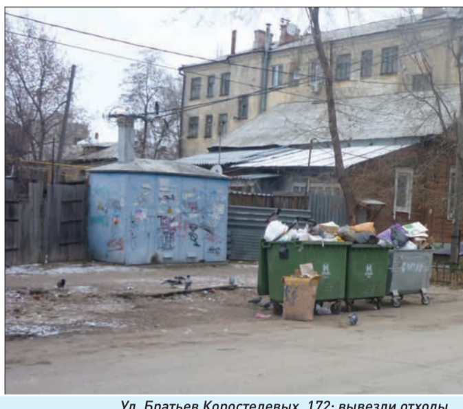
Ул. Братьев Коростелевых, 172: вывезли отходы