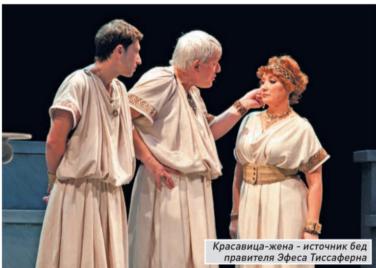
Красавица-жена - источник бед правителя Эфеса Тиссаферна