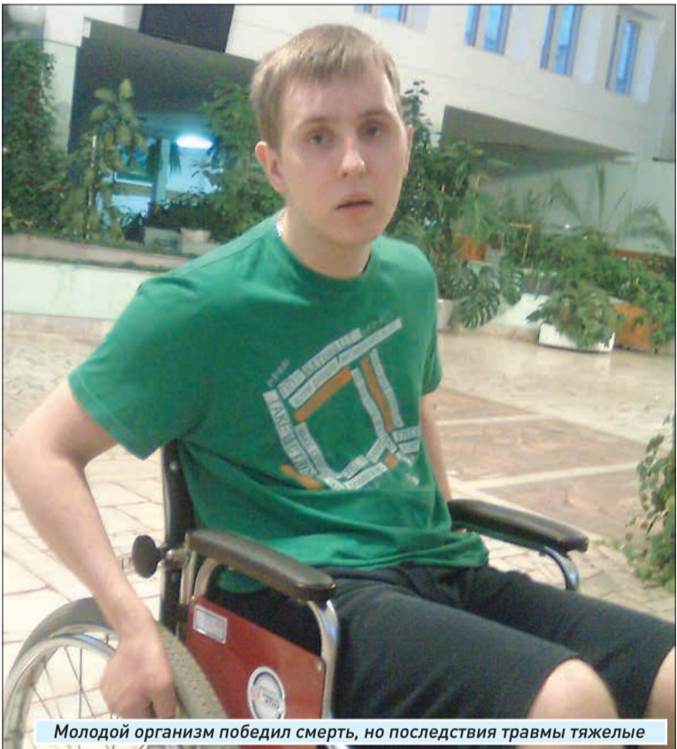
Молодой организм победил смерть, но последствия травмы тяжелые