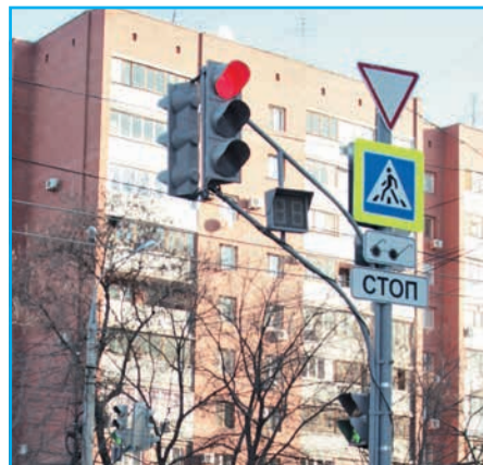
Пересечение ул. Нагорной и пр. Кирова оборудовали светофорами