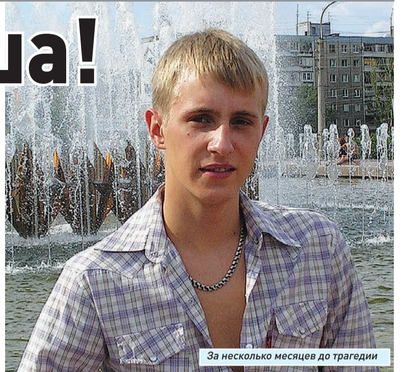
За несколько месяцев до трагедии