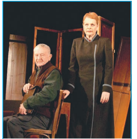
В театре «Актерский дом» поставили пьесу Максима Горького. стр. 7