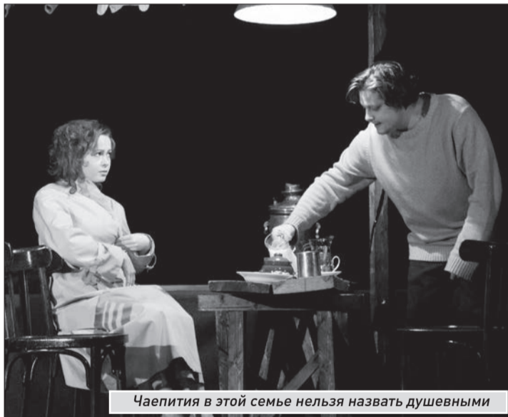
Чаепития в этой семье нельзя назвать душевными