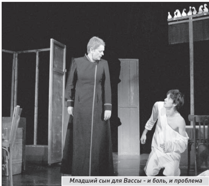
Младший сын для Вассы - и боль, и проблема