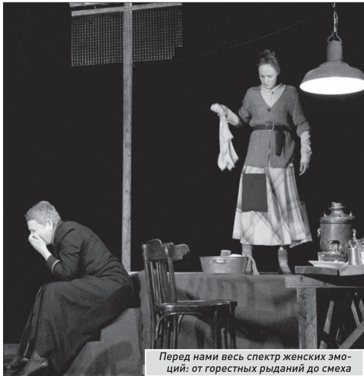
Перед нами весь спектр женских эмоций: от горестных рыданий до смеха