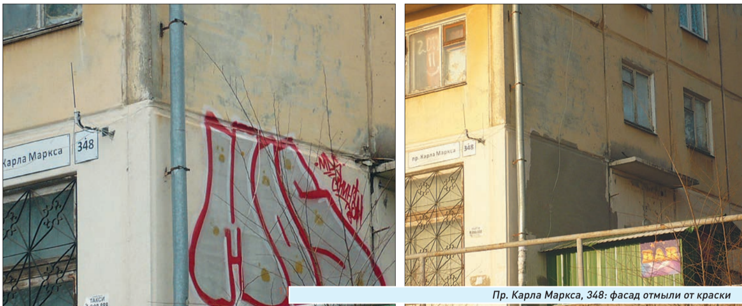
Пр. Карла Маркса, 348: фасад отмыли от краски

| Уличное искусство не должно портить городские дома