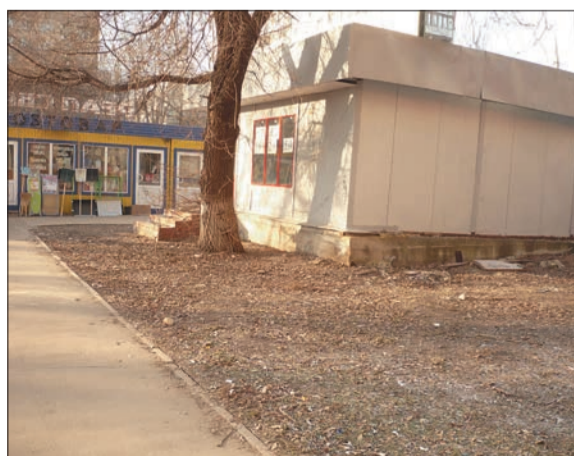
Подготовила Алена СЕМЕНОВА

Просьба горожан была услышана. По поручению административно-технической инспекции по благоустройству территорию привели в порядок. Жители окрестных домов остались довольны результатами уборки: от мусора не осталось и следа. Они надеются, что владельцы торговых павильонов будут поддерживать здесь чистоту.