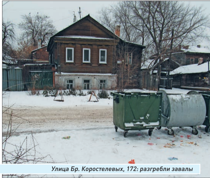
Улица Бр. Коростелевых, 172: разгребли завалы