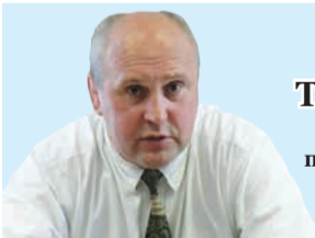
Николай ТУРБОВЕЦ начальник полиции ГУ МВД по Самарской области: