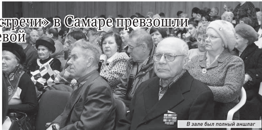
В зале был полный аншлаг