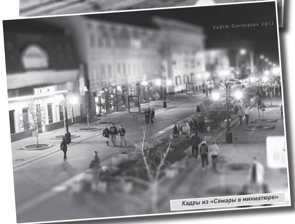
Кадры из «Самары в миниатюре»