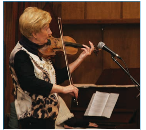
«Рождественские встречи» в Самаре превзошли столичный аналог с Аллой Пугачевой СТР. 3

курс валют сегодня | $ 30.26 | € 40.40 | погода на завтра | gismeteo.ru | День | -6 | пасмурно, снег, ветер Ю-В, 3 м/с | давление 750 | влажность 86% | Ночь | -9 | пасмурно, снег, ветер Ю, 2 м/с | давление 752 | влажность 88%