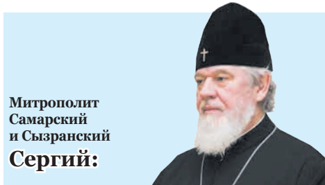
Митрополит Самарский и Сызранский Сергий: