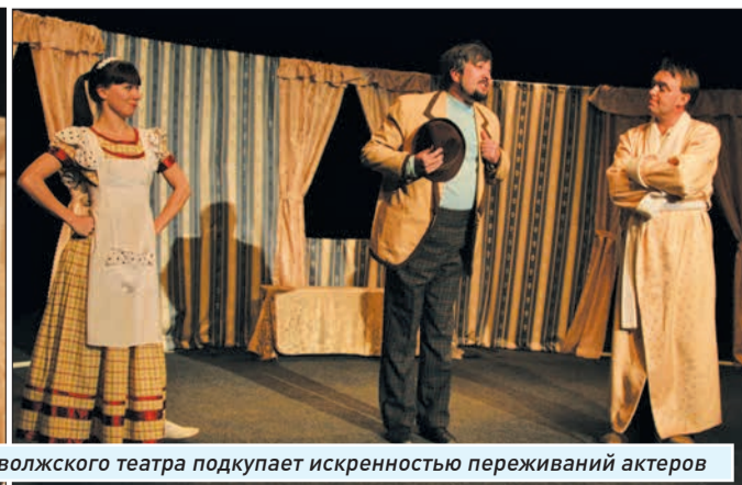
Труппа из Приволжского театра подкупает искренностью переживаний актеров