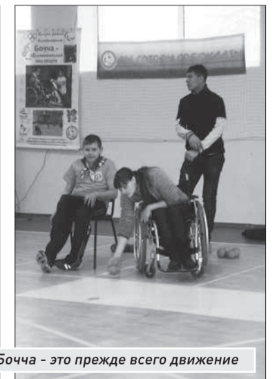
Бочча - это прежде всего движение

Когда все мячи выброшены на корт, рефери объявляет конец партии и начисляет очки той команде (игроку), чей шар (шары) оказывается самым близким к джеку.