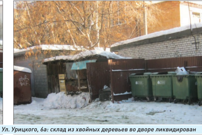
Ул. Урицкого, 6а: склад из хвойных деревьев во дворе ликвидирован