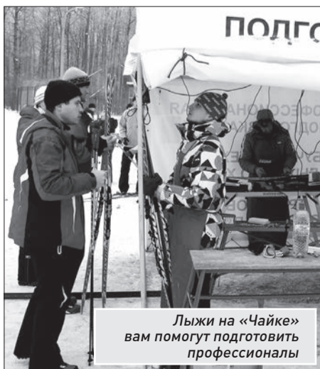
Лыжи на «Чайке» вам помогут подготовить профессионалы