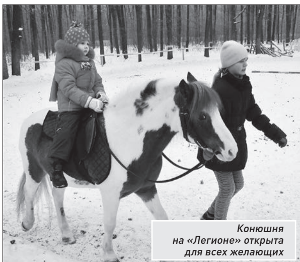
Конюшня на «Легионе» открыта для всех желающих

XXXI Всероссийская массовая лыжная гонка «Лыжня России» проводится ежегодно начиная с 1982 года. По традиции участниками массового забега в Самарской области станут более 15 тысяч человек. Наряду с любителями на старт выйдут спортсмены-профессионалы, олимпийские чемпионы, ветераны. Победителей ждут медали, дипломы, памятные призы и ценные подарки от министерства спорта Самарской области. На территории УСЦ «Чайка» покажут концертную программу, будут работать площадки - детская, различных спортивных федераций, ДОСААФ, каток. Подать заявки на участие и получить стартовый номер и шапочку с эмблемой «Лыжня России-2013» можно по адресу: УСЦ «Чайка», п. Управленческий, 66, квартал Самарского лесничества, с 6-го по 10 февраля с 9-00 до 18-00.