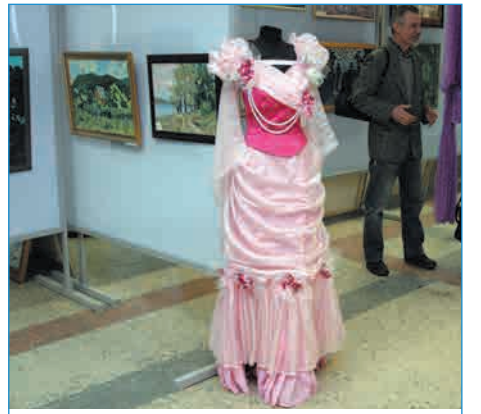
Открылась выставка театрального художника Натальи Хохловой СТР. 30