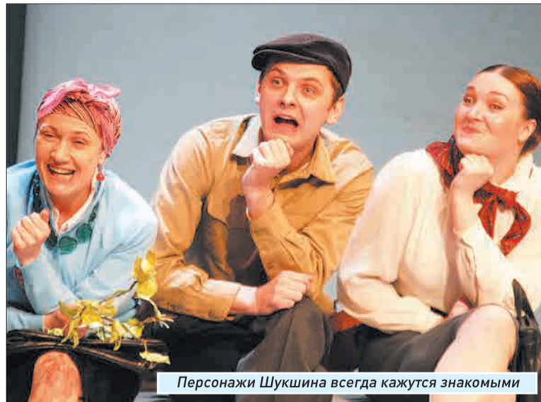
Персонажи Шукшина всегда кажутся знакомыми

А может быть, герои Шукшина только кажутся похожими, потому что в каждом из них есть нечто узнаваемое, привычное. И в продавщице, которая крупу продает, словно забытый долг возвращает, и в стервозной теще Вени Зяблицкого, которая пересажала в тюрьму всех мужчин в семье, и в демагоге Глебе Капустине, который в словесных поединках «срезает» односельчан, добившихся успеха.