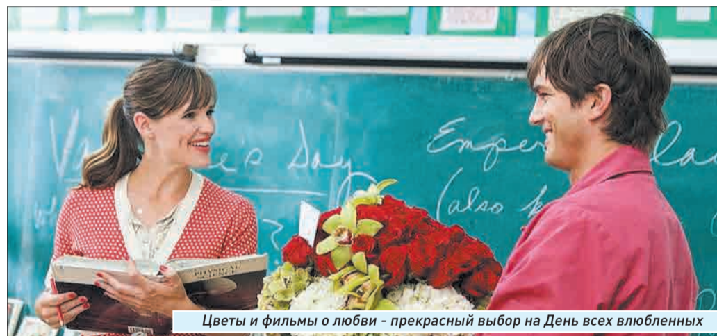
Цветы и фильмы о любви - прекрасный выбор на День всех влюбленных

2011, Франция, режиссер Фабрис Марука, комедия, 11 мин.