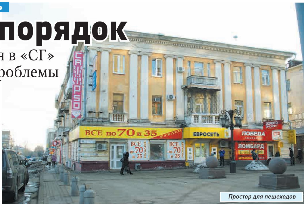
Простор для пешеходов

Так, на улице Ленинградской, 69 двор был совершенно не расчищен. Вокруг сугробы. А пешеходную дорожку покрывал скользкий лед. Разумеется, это доставляло серьезные неудобства. Впрочем, ситуацию быстро исправили. По предписанию Городской административно-технической инспекции по благоустройству в этом дворе навели порядок. Обслуживающая организация расчистила снег. Бытовой мусор был вывезен.