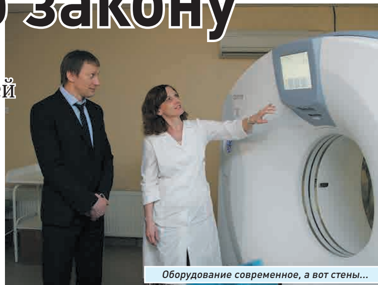
Оборудование современное, а вот стены...

Журналистам их продемонстрировали. Так, в отделении онкогематологии, где лечат тяжелобольных детишек и где в палатах должна быть абсолютная стерильность (у пациентов на химиотерапии низкий иммунитет), на свежотремонтированных стенах уже выступил грибок (это говорит о том, что была нарушена технология в процессе производства работ), не завершены и монтаж новой вентиляции.