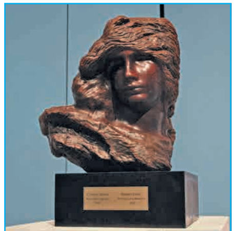
В Музее им. Алабина открылась экспозиция работ Степана Эрзы стр. 94