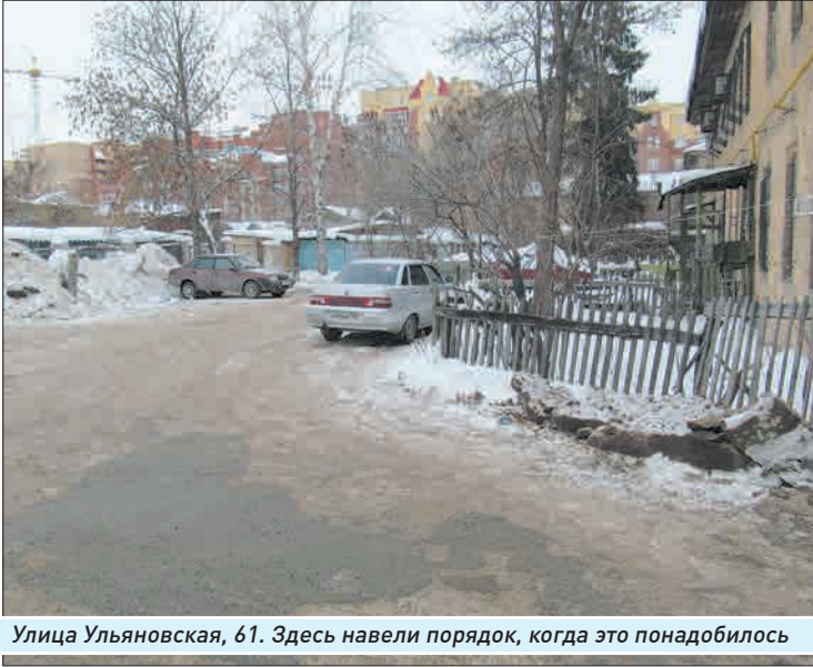
Улица Ульяновская, 61. Здесь навели порядок, когда это понадобилось