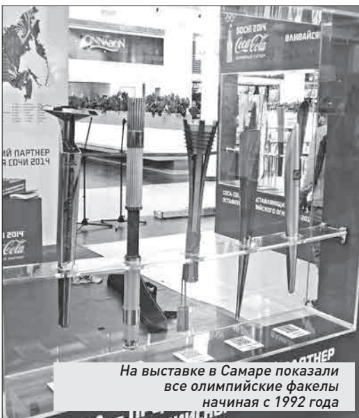
На выставке в Самаре показали все олимпийские факелы начиная с 1992 года