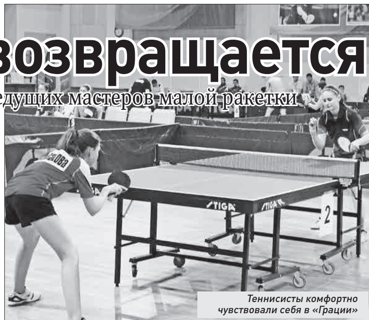
Теннисисты комфортно чувствовали себя в «Грации»

«Самарочка», одержав пять побед, вышла на третье место в женской суперлиге. Вторая команда заняла пятое. Мужчины были еще дальше - только шестые из 12 команд высшей лиги «А».