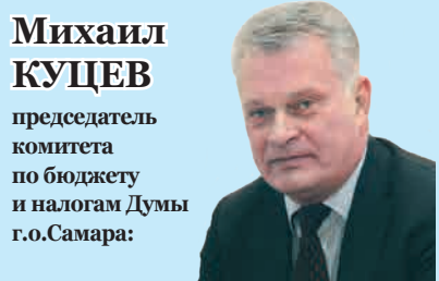
Михаил КУЦЕВ председатель комитета по бюджету и налогам Думы г.о.Самара: