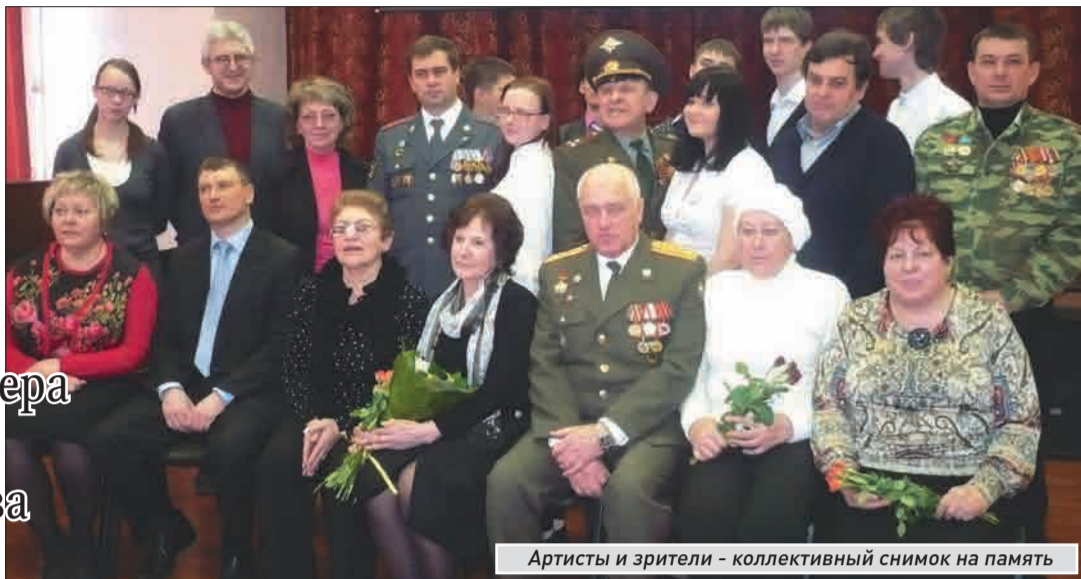
Артисты и зрители - коллективный снимок на память

К этой необычной постановке серьезно готовились и взрослые, и ребята. Премьера прошла в актовом зале школы. Актеры - воспитанники творческой лаборатории театра-студии Motogia, несмотря на сложность материала, с задачей справились.