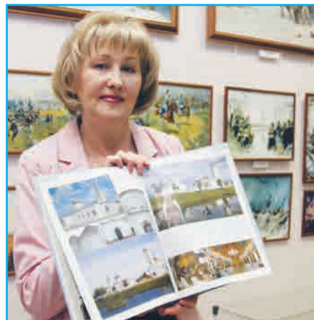
Выпущен альбом по малоизученному зодчеству Самарского региона стр. 8