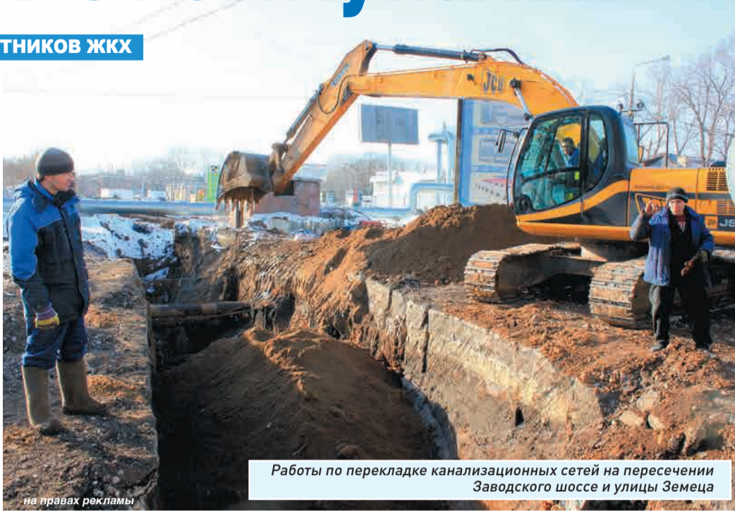
Работы по перекладке канализационных сетей на пересечении Заводского шоссе и улицы Земеца

Стоит ли из-за этого отказываться от идеи развития рынка профессионального управления жилфондом? Пожалуй, не стоит. Надо вспомнить, что УК были придуманы реформаторами не от хорошей жизни и сама по себе идея конкурентного управления жильем прогрессивнее монополии муниципальных ЖЭКов. Смысл в том, чтобы эту конкуренцию активнее развивать. УК, разделившие город, как пирог, по кускам