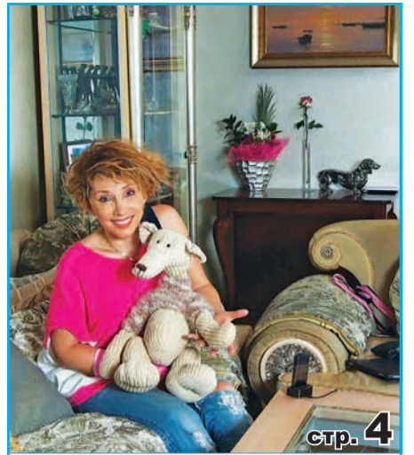
Гость номера - народная артистка Елена Воробей