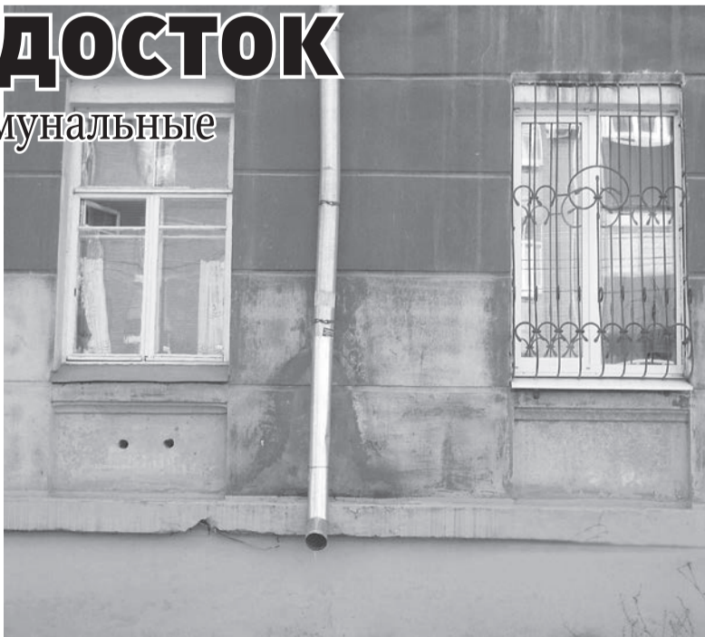
Подготовила Алена СЕМЕНОВА

Как оказалось, это не единичный в Самаре случай. «СГ» выяснила: в городском департаменте ЖКХ управляющим компаниям дано поручение обратить внимание на водостоки. Их необходимо привести в порядок на всех жилых домах хотя бы к этому лету. А вот по улице А. Матросова трубу уже починили. Может, со стороны это выглядит не совсем эстетично, зато свою главную функцию - отводить дождевую воду - она теперь выполняет. По крайней мере горожане довольны.