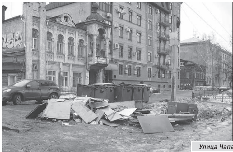
Улица Чапаевская, 108