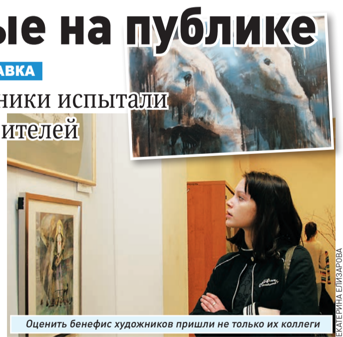
Оценить бенефис художников пришли не только их коллеги

Пространство экспозиции поделено на именные сектора, что позволяет посетителю поочередно погружаться в художественный мир каждого участника выставки. Причудливые скульптуры, декоративные пейзажи и философские картины - авторы старались показать все, что накопили за годы