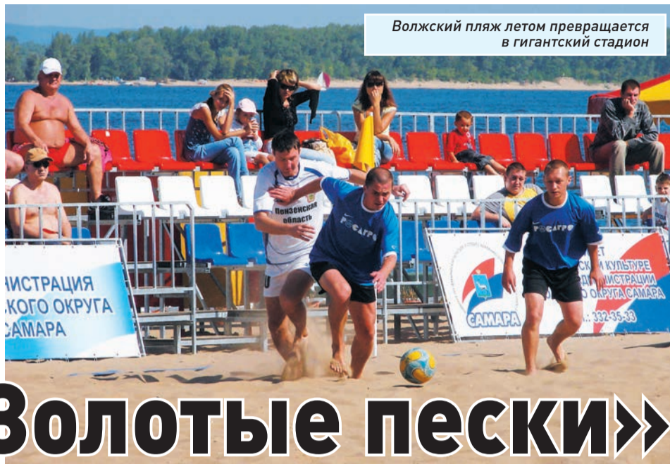
Волжский пляж летом превращается в гигантский стадион

Словом, уже скоро Ассоциация громко заявит о себе. Чем завлечь и развлечь гостей и туристов грядущего мундиала? На помощь придут «Золотые пески Самары»!