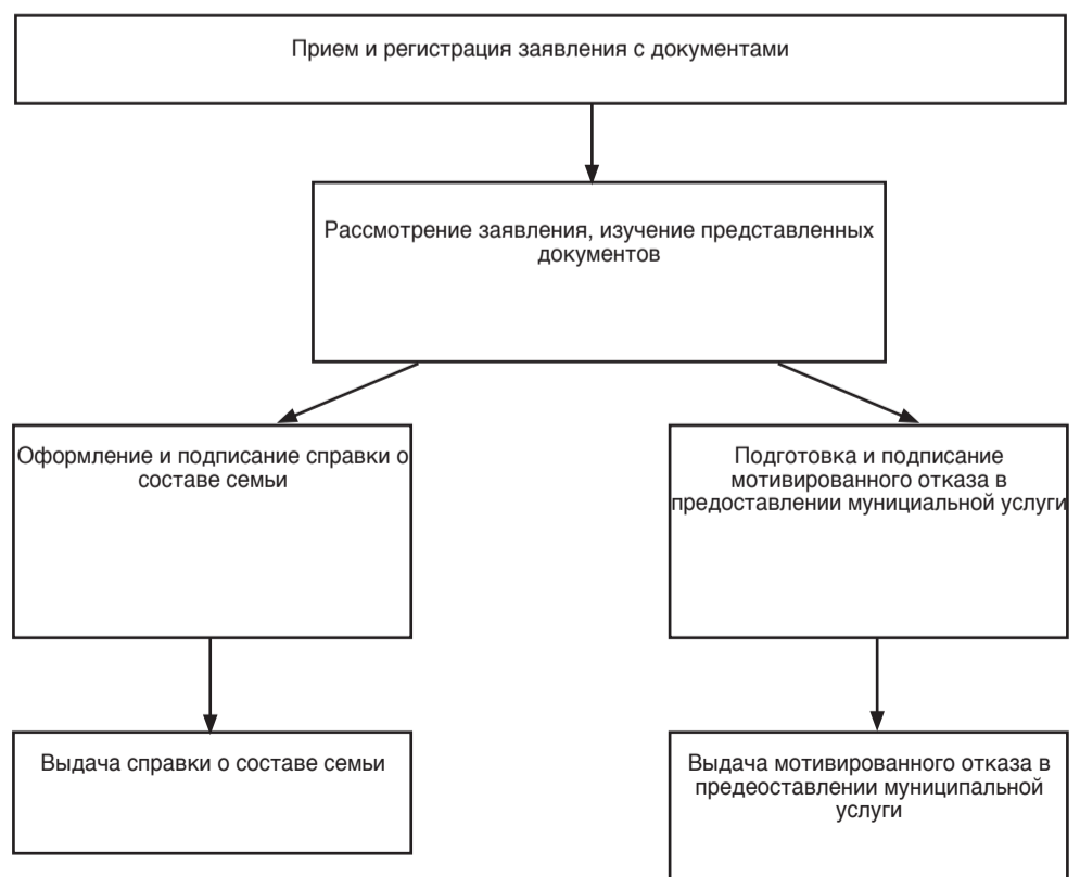
Блок-схема предоставления муниципальной услуги

к Административному регламенту предоставления муниципальной услуги «Оформление документов, подтверждающих факт регистрации граждан по месту жительства и месту пребывания в домах частного жилищного фонда на территории городского округа Самара (справок о составе семьи)»