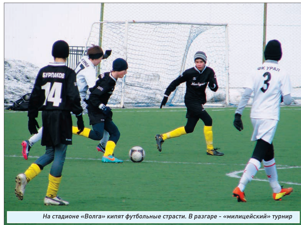
На стадионе «Волга» кипят футбольные страсти. В разгаре - «милицейский» турнир