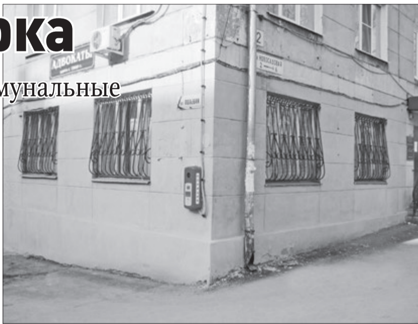
Подготовила Алена СЕМЕНОВА

Что и было сделано по поручению городской административно-технической инспекции по благоустройству. Здание теперь выглядит совсем по-другому. Кроме того, фасад отчистили и от несанкционированных бумажных объявлений. Они тоже явно не добавляли дому красоты.