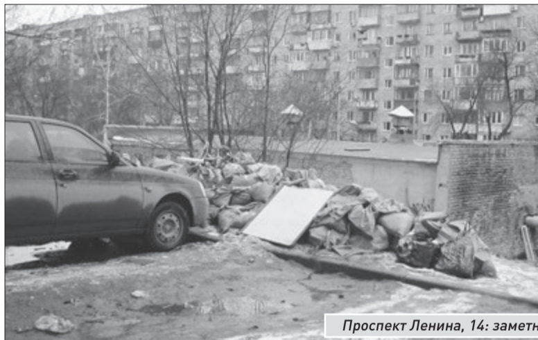
Проспект Ленина, 14: заметные перемены к лучшему